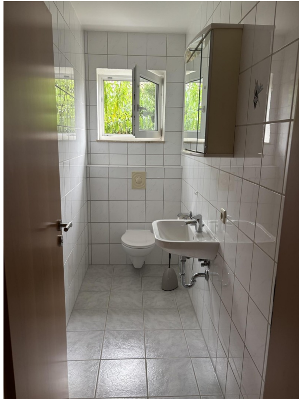
Gäste WC EG