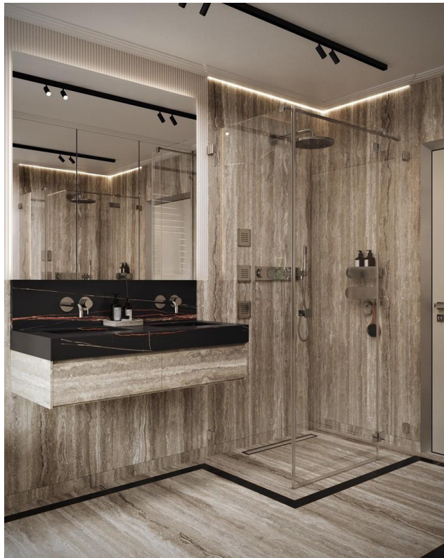
Bad mit Dusche 2