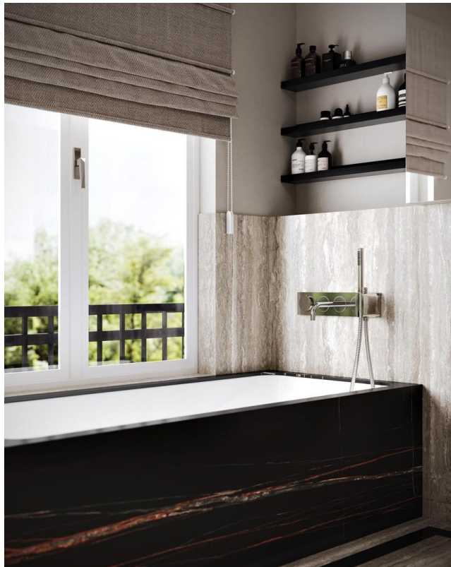
Design Badewanne nach Vorgaben