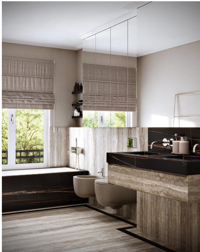
Bad mit Badewanne