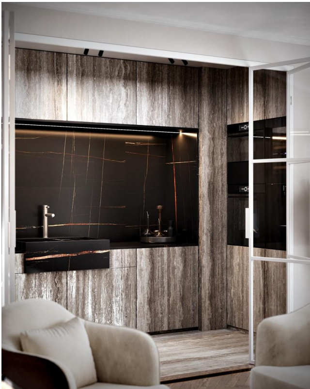
Wohnküche mit Falttüren