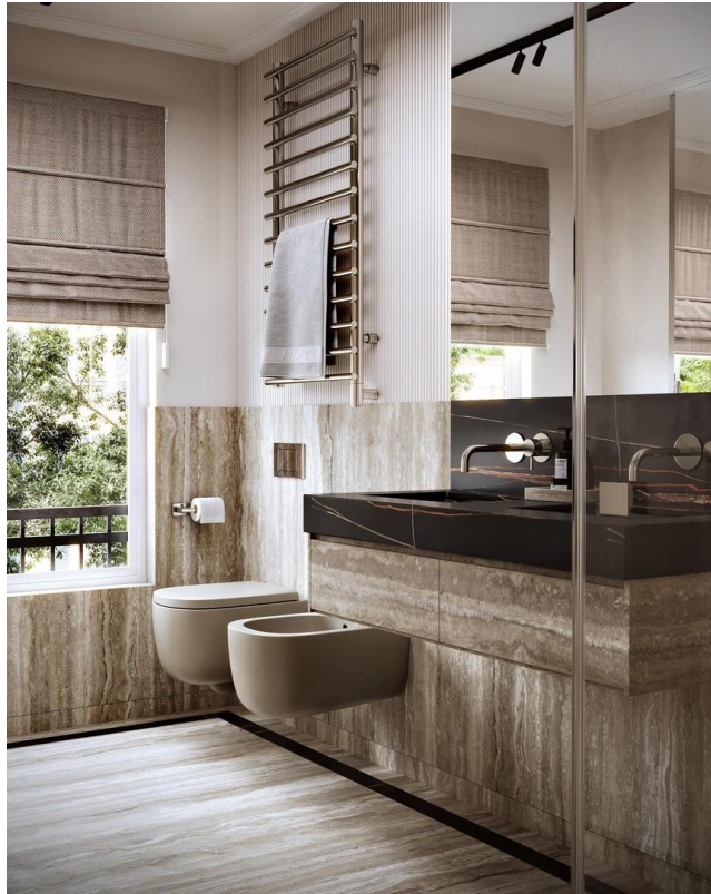
Bad mit Dusche 3