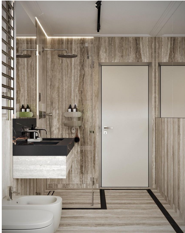
Bad mit Dusche