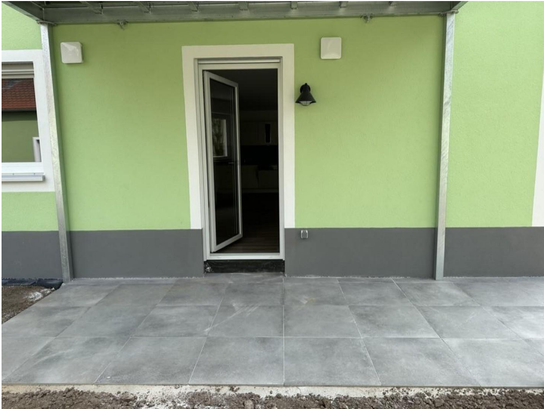
Terrasse vom Wohnraum aus