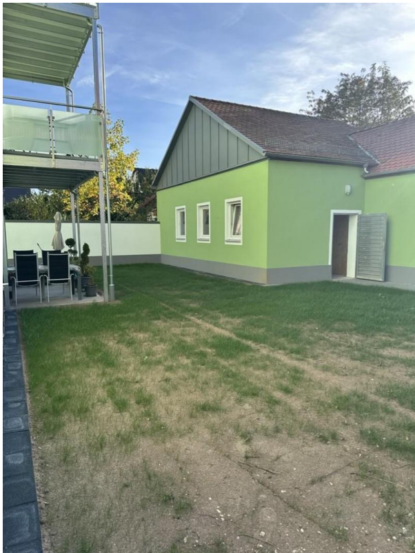
Rückgelände mit Terrasse