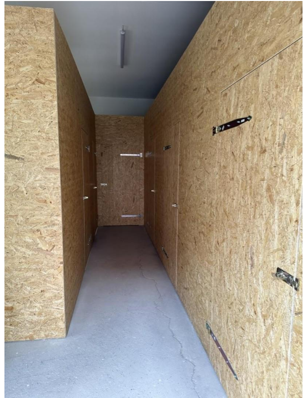
Kellerraum im Nebengebäude