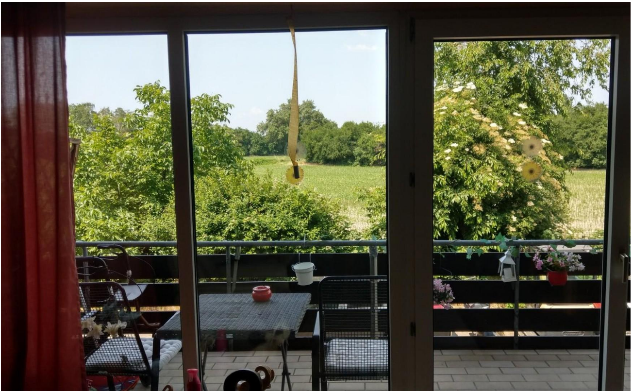
Sicht vom Wohnzimmer