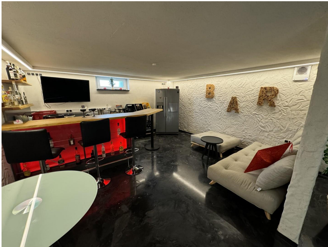
Lounge / Bar mit Luftumwälzung