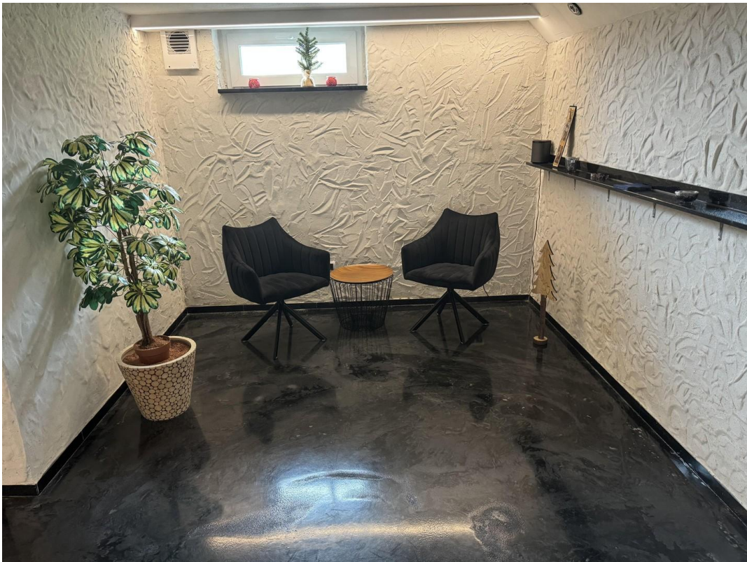
Lounge / Bar mit Luftumwälzung