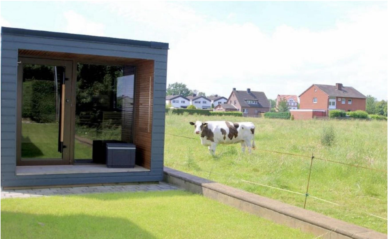
Sauna und Ausblick