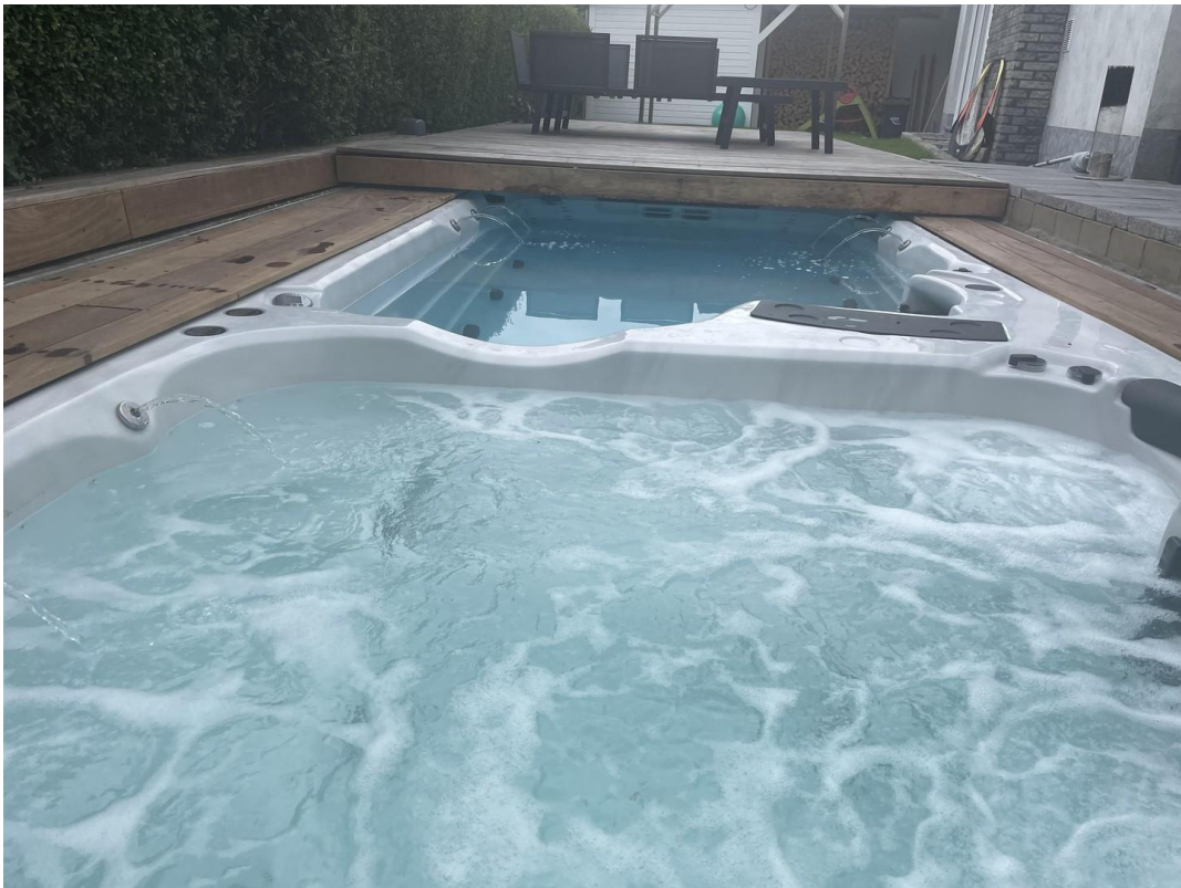
Pool mit Schieberdeck