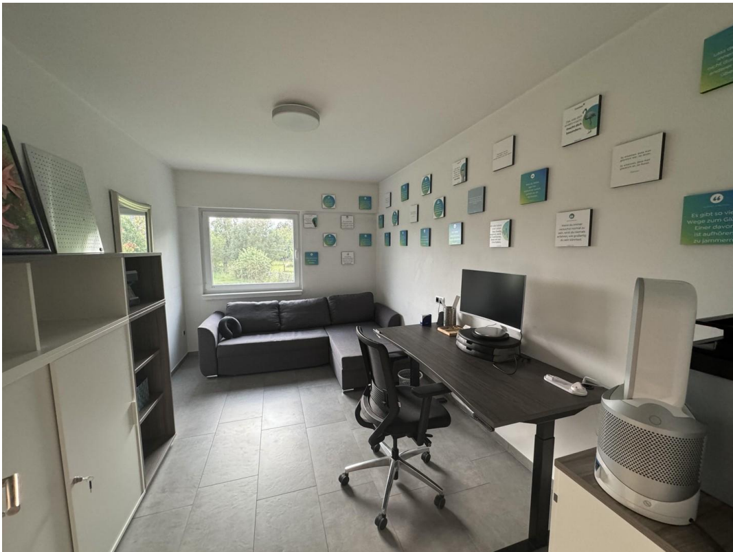
Büro/Gäste- oder Kinderzimmer