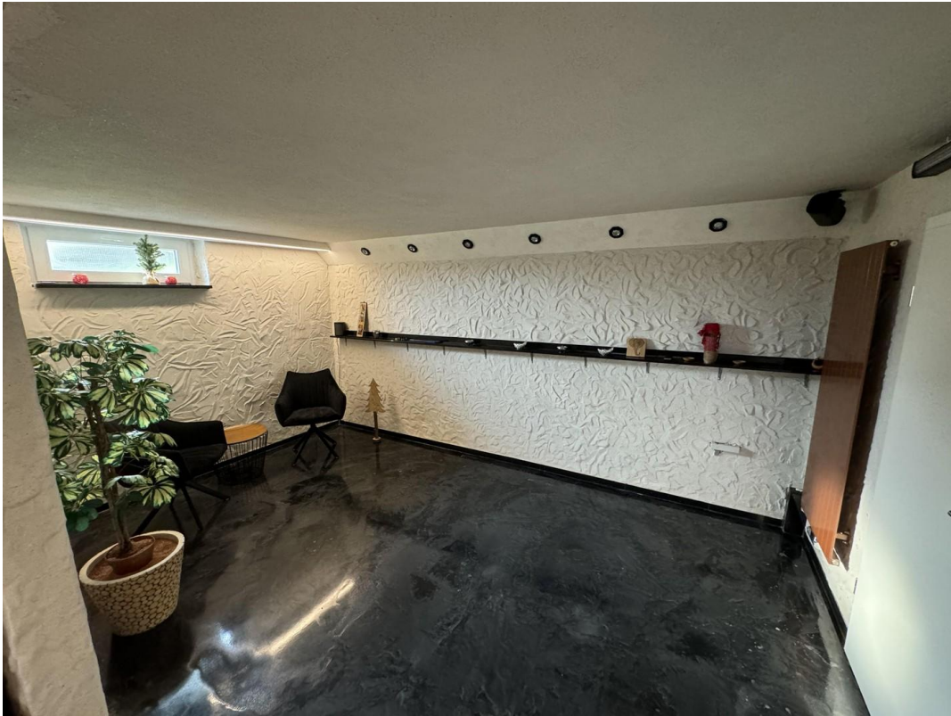
Lounge / Bar mit Luftumwälzung