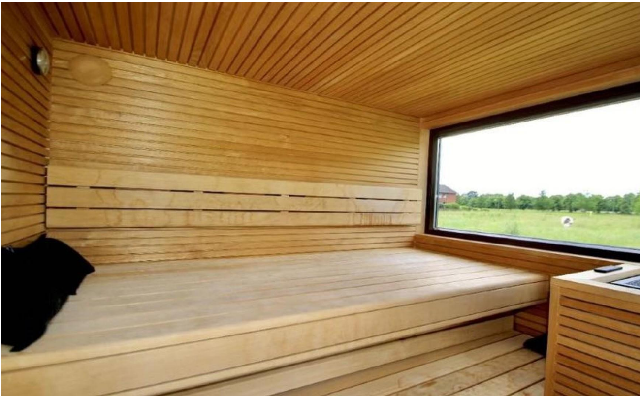
Sauna mit Ausblick