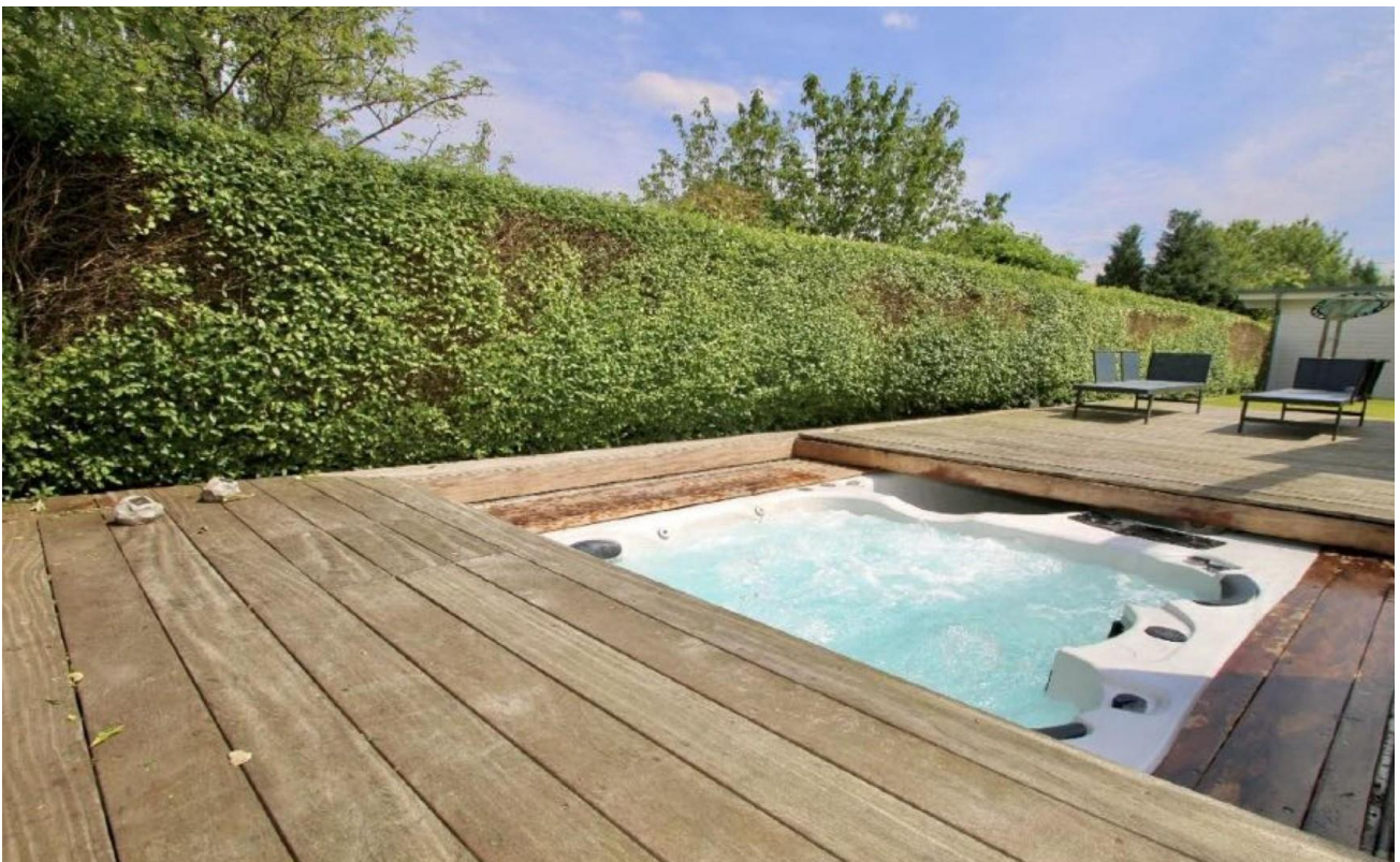
Lounge / Bar mit Luftumwälzung