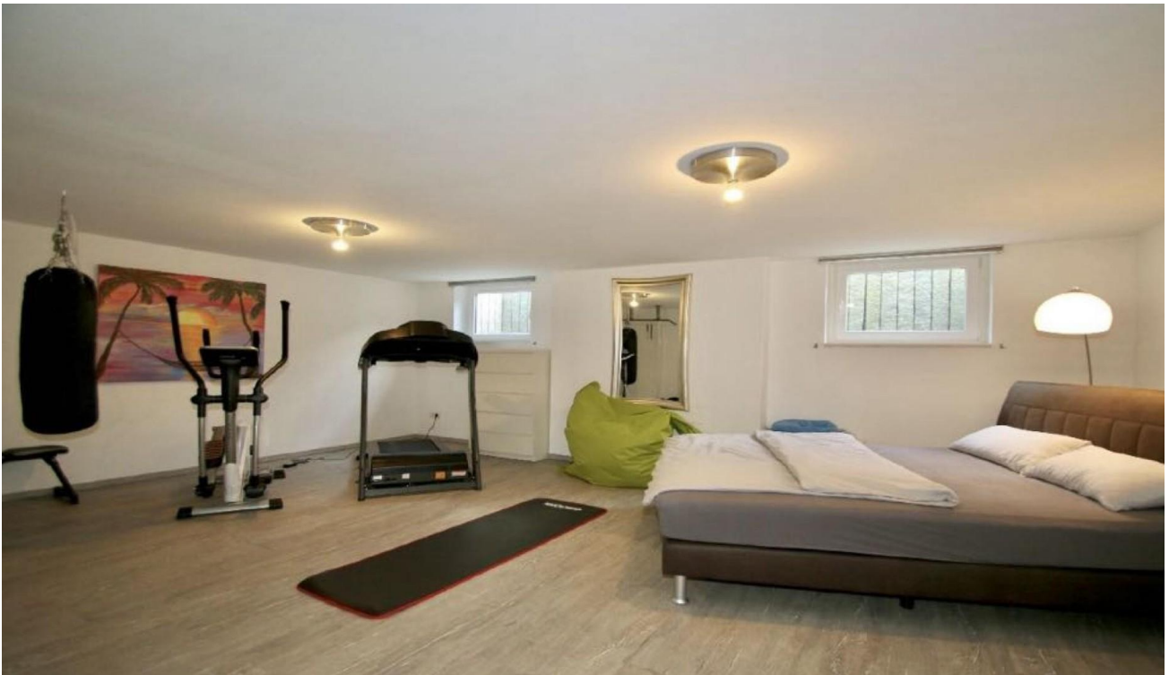
Hobbyraum / Gästezimmer Keller