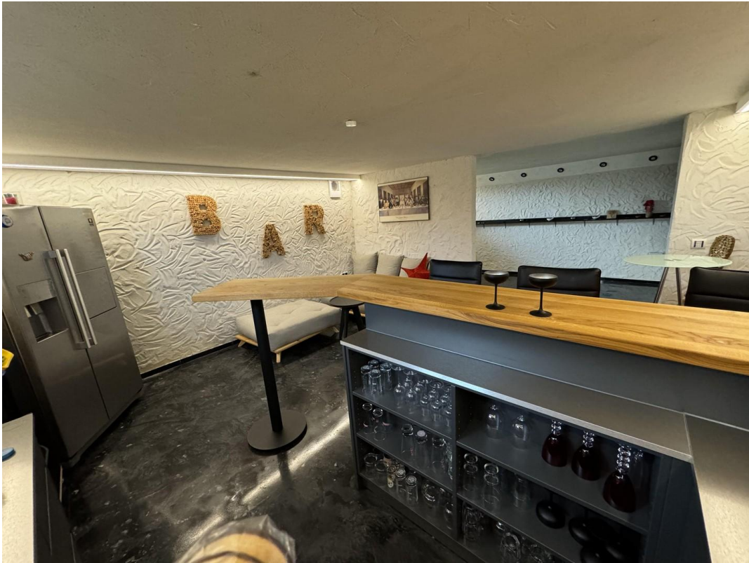
Lounge / Bar mit Luftumwälzung