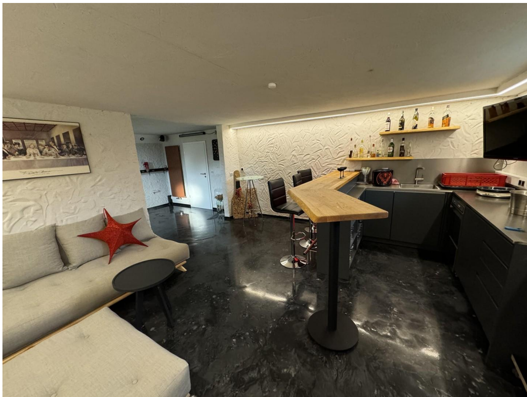
Lounge / Bar mit Luftumwälzung