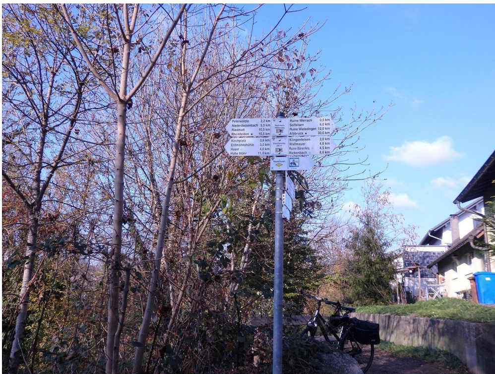
Wegweiser bei Holzbrücke