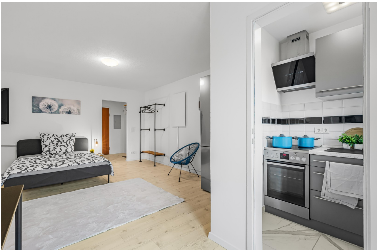
Wohn-/Esszimmer und Küche