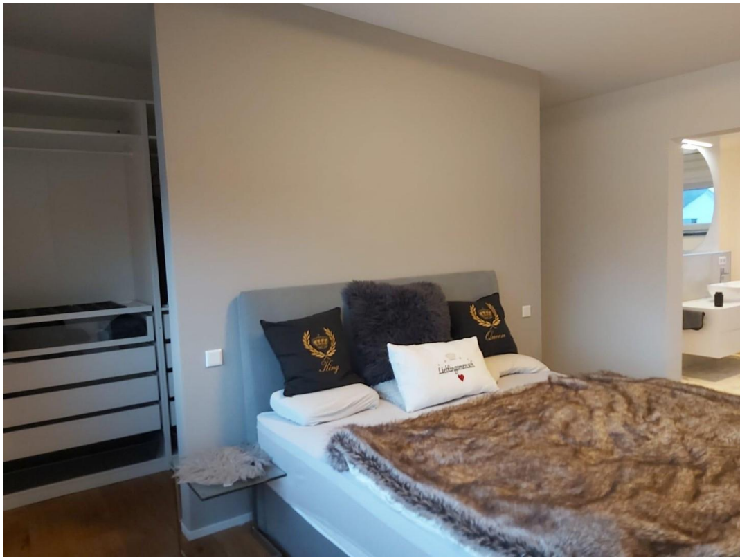
Schlafen +begeh. Kleiderschr.