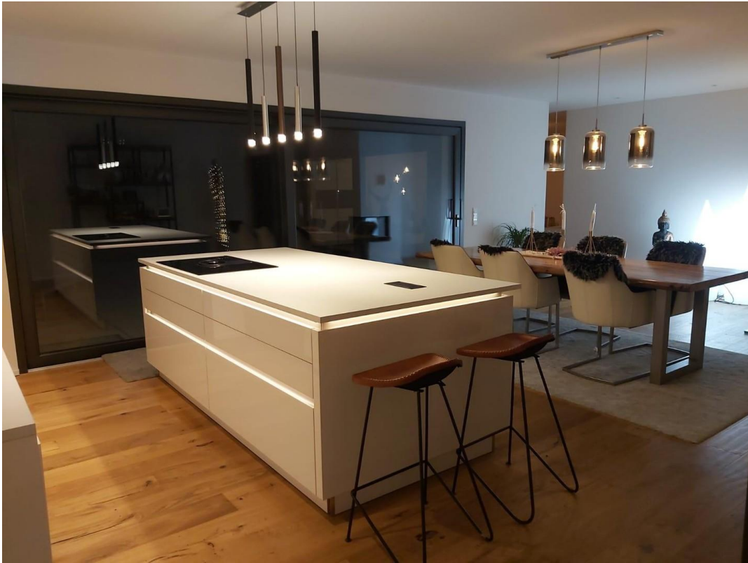
Küche + Beleuchtung