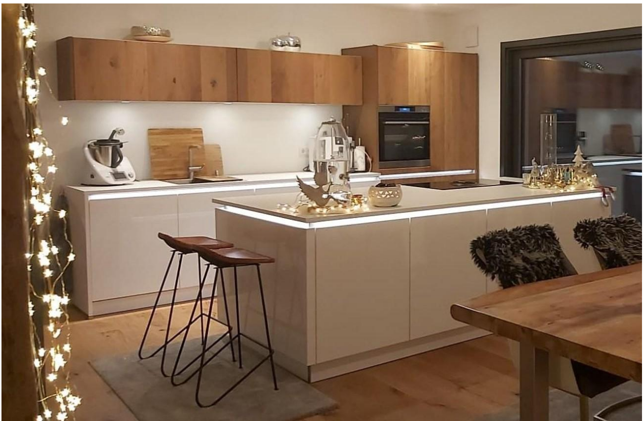
Esszimmer + Küche