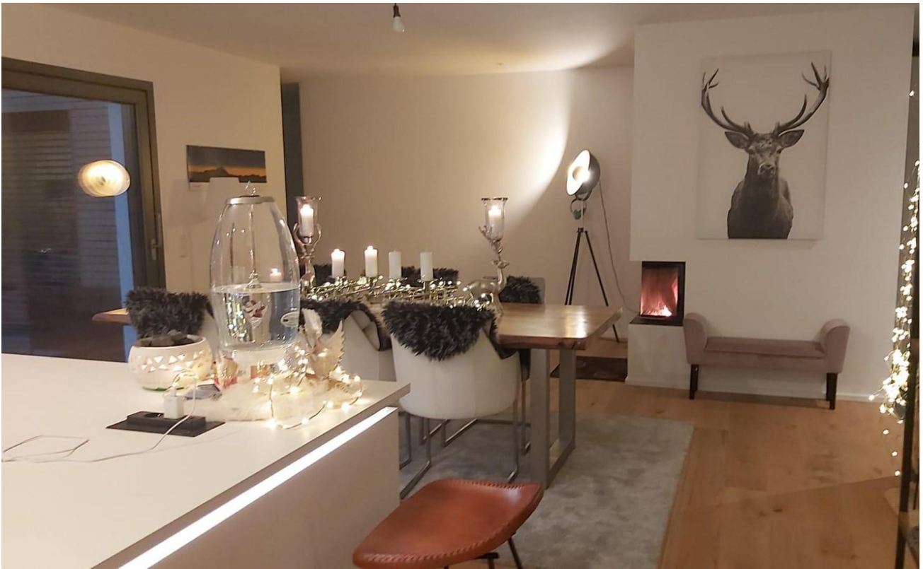
Essen + Kamin