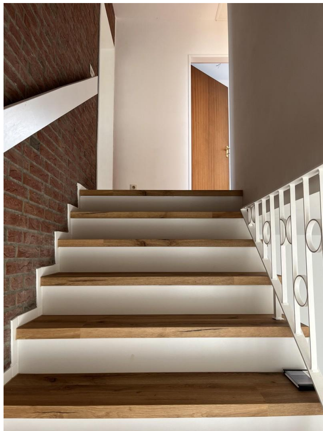
Treppe ins OG