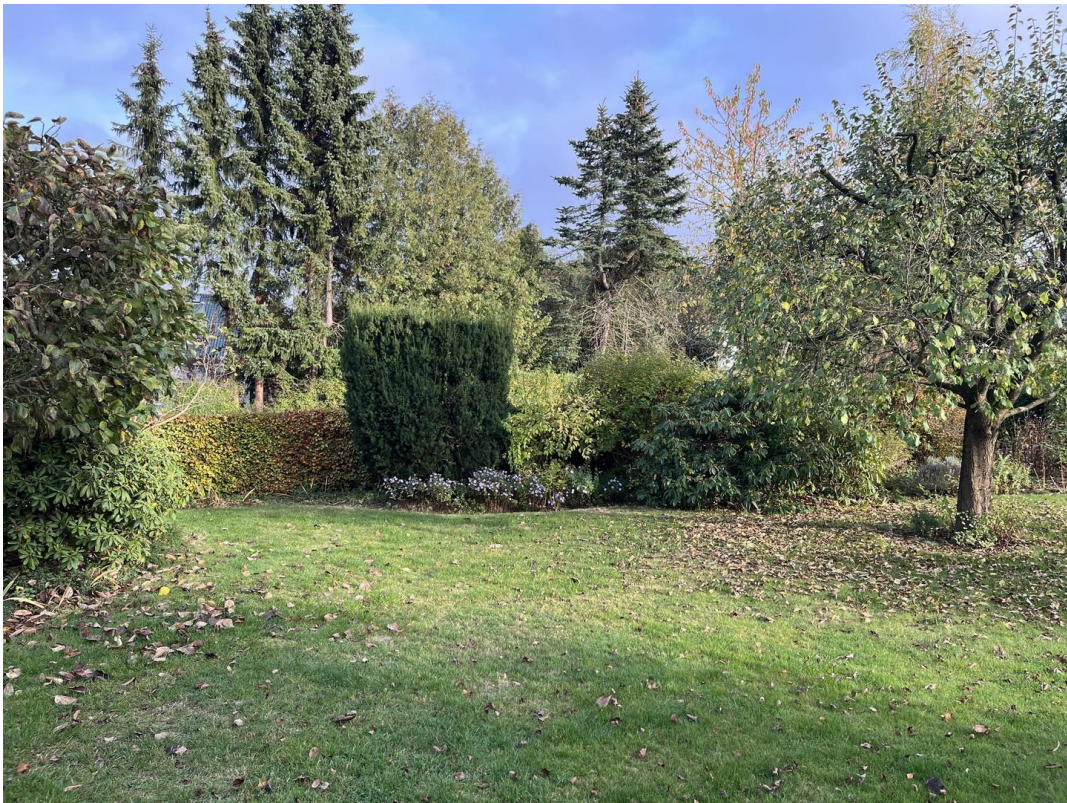
Garten nach Süden