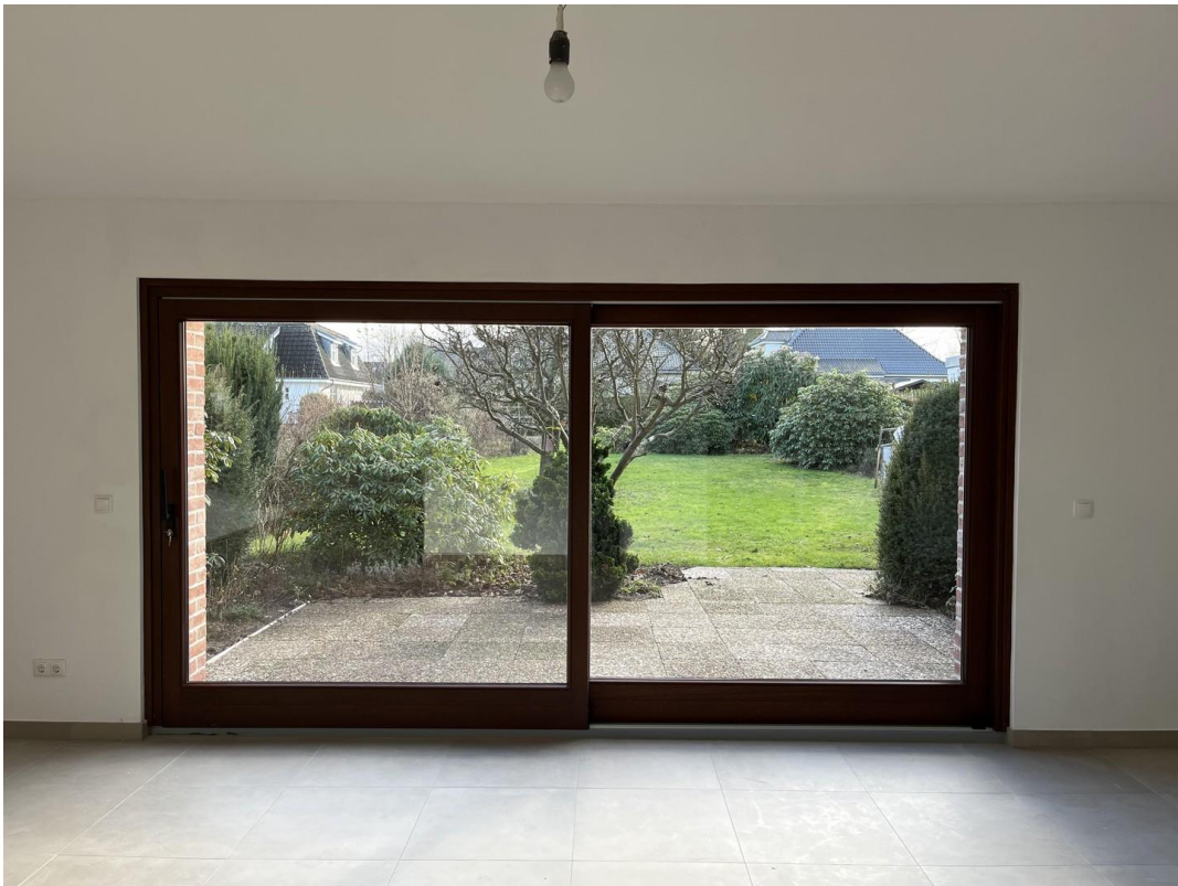
Gartenblick vom Wohnzimmer