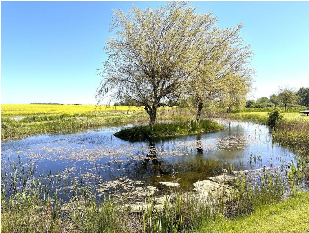
Teich mit Insel