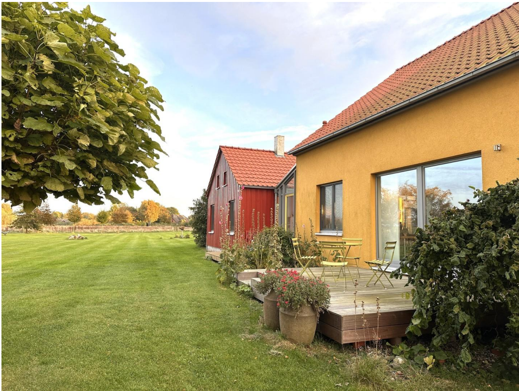
Haupthaus - Frühstücksterrasse