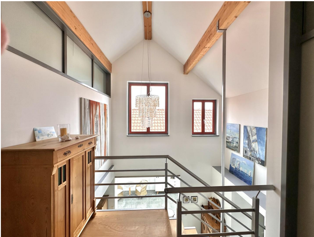
Haupthaus - Galerie