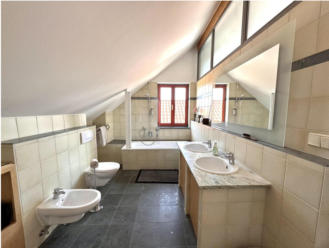
Haupthaus - Bad