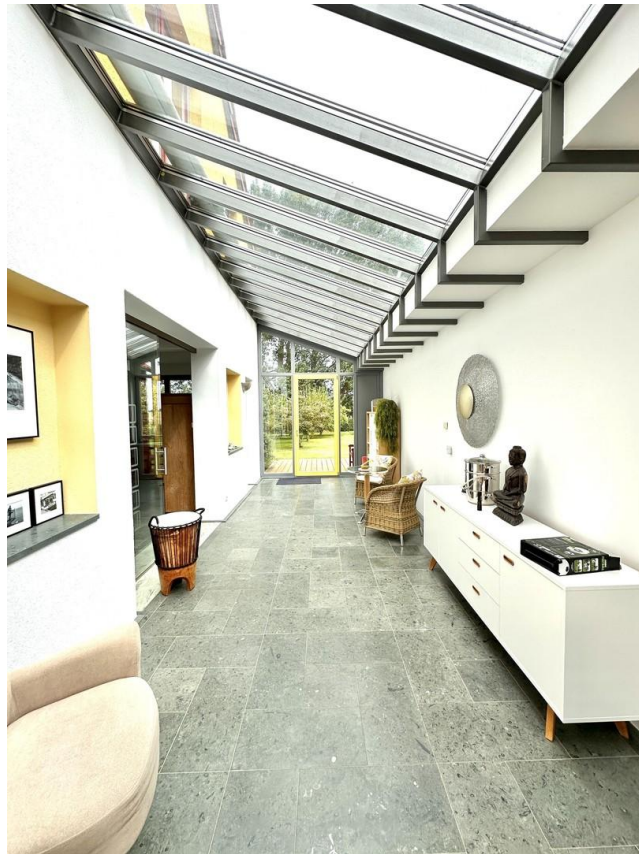
Wintergarten / Entree