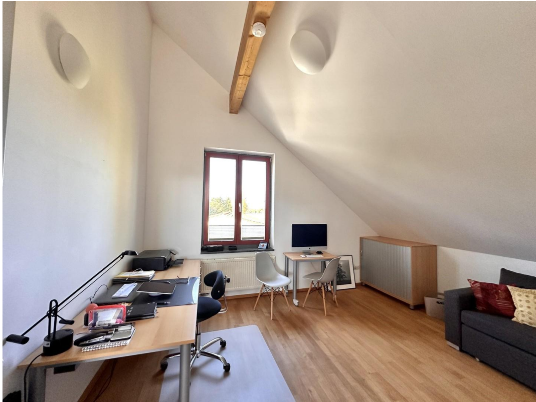
Haupthaus - Schlafzimmer 1