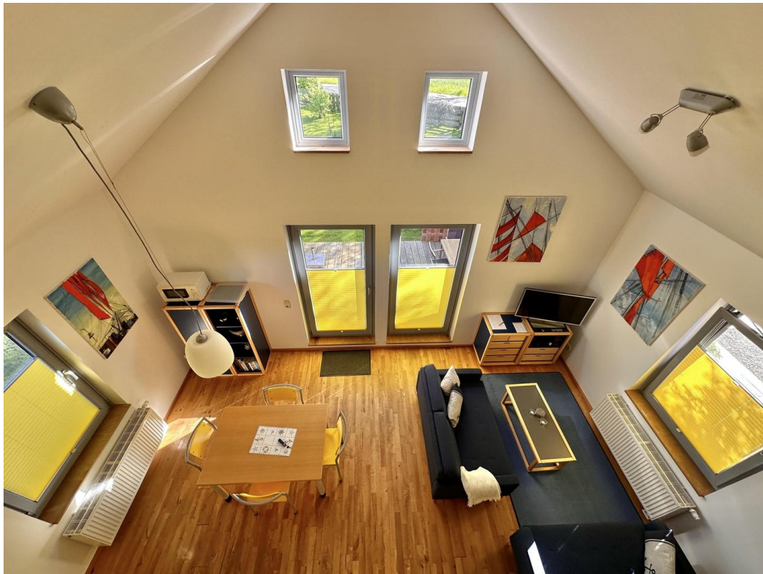
Haus 3 - Galerieblick