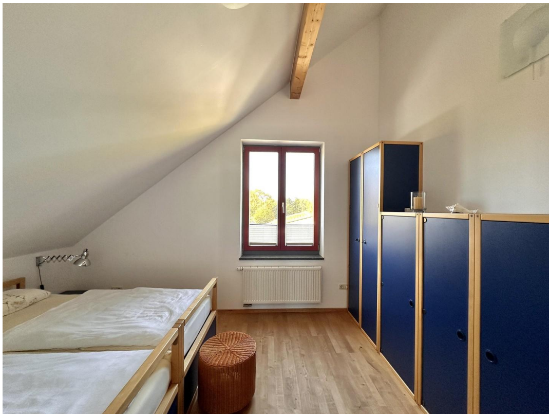
Haupthaus - Schlafzimmer 2