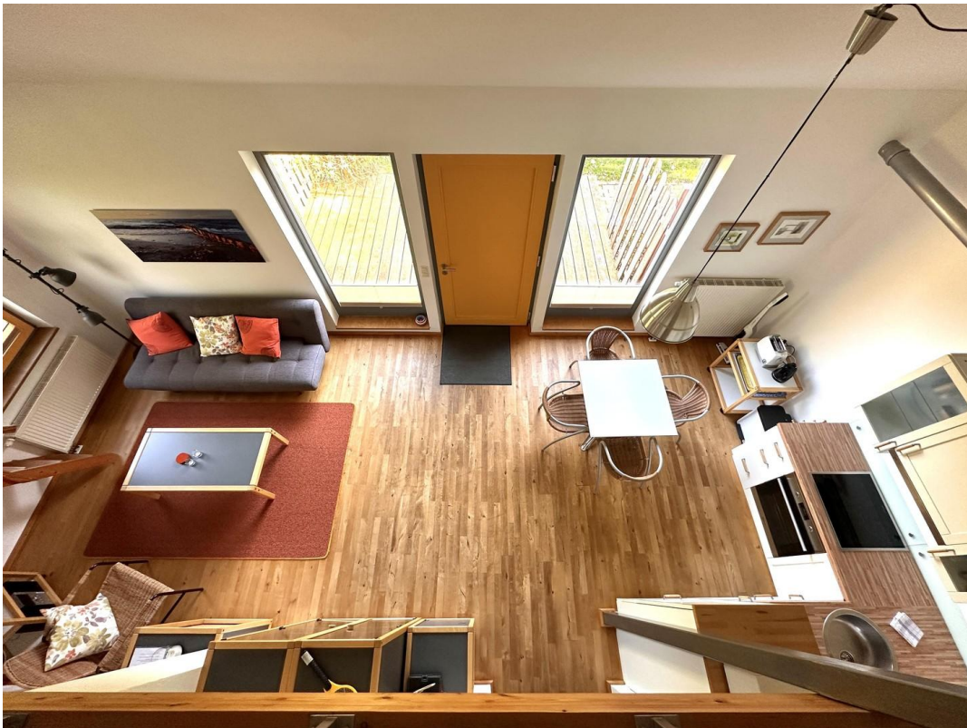
Haus 2 - Galerieblick