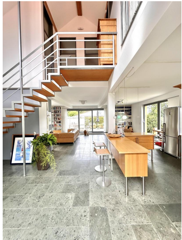
Haupthaus - Blick vom Entree