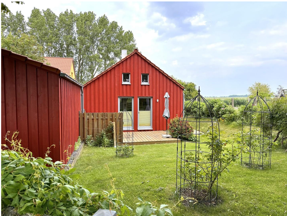
Haus 3 - Terrasse