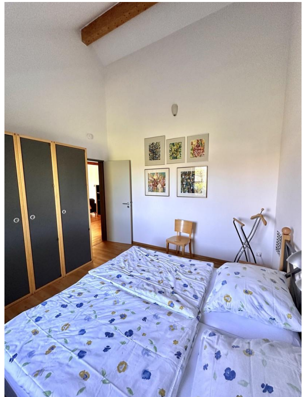
Haus 3 - Schlafzimmer