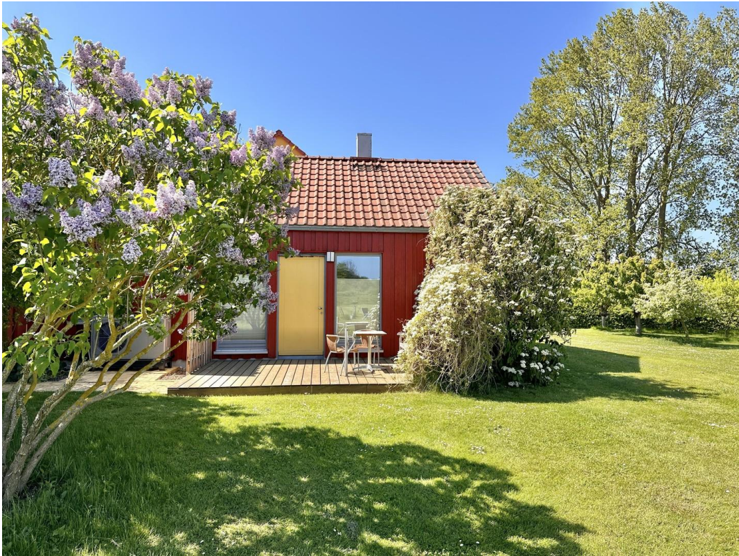
Haus 2 - Terrasse