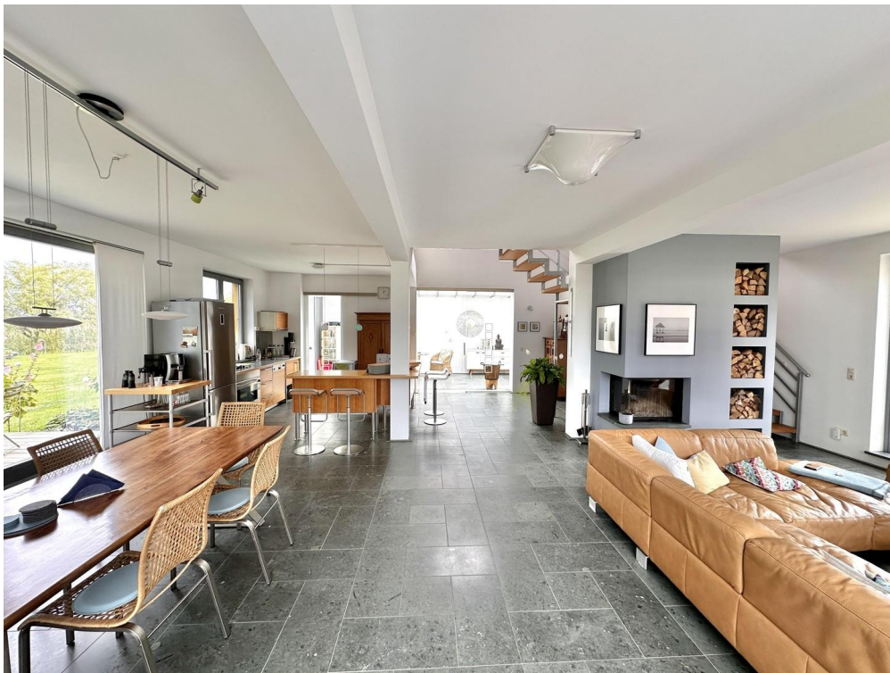
Haupthaus - Wohn-/Esszimmer