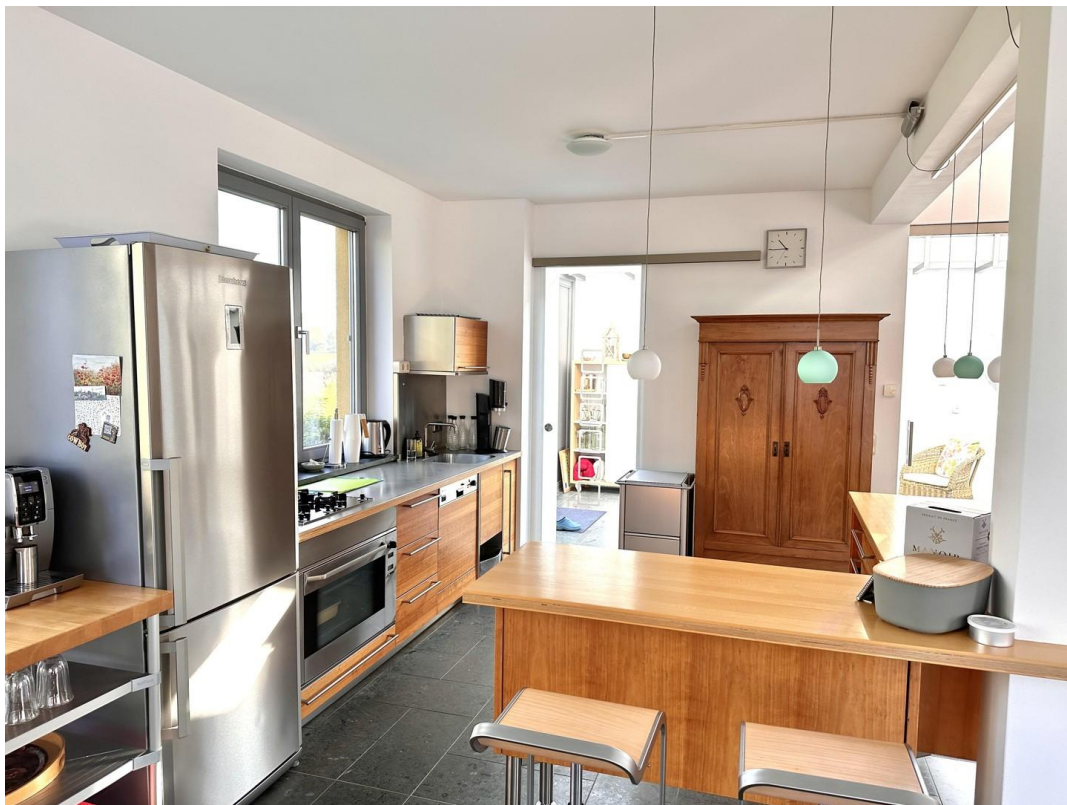
Haupthaus - Küche