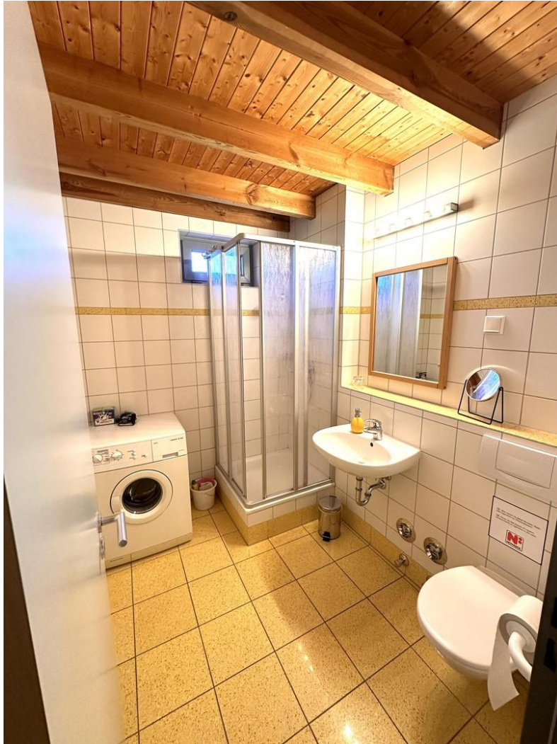
Haus 3 - Bad