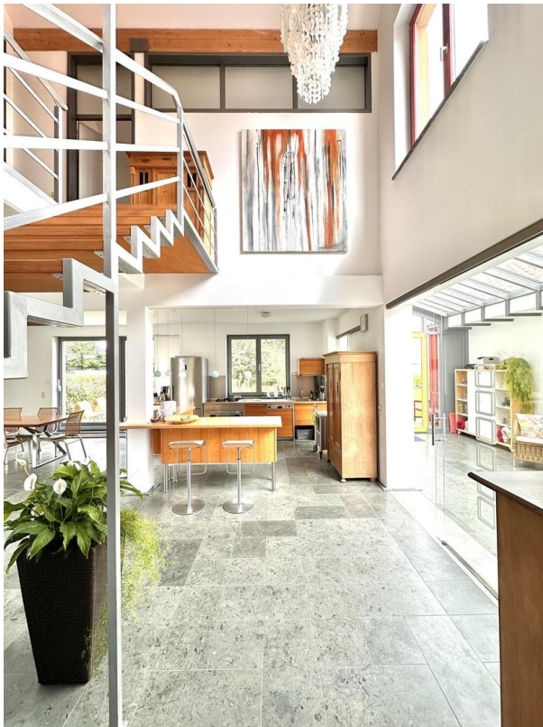
Haupthaus-Blick Richtung Küche