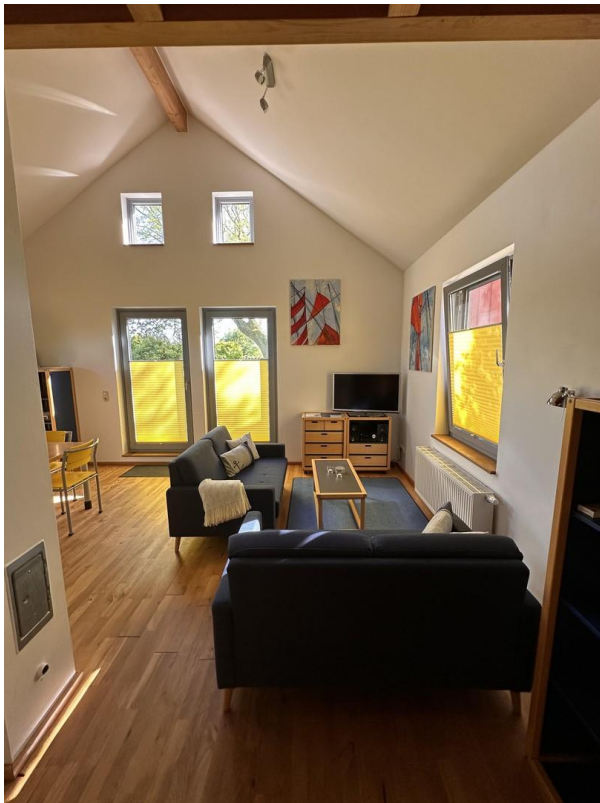
Haus 3 - Wohnbereich