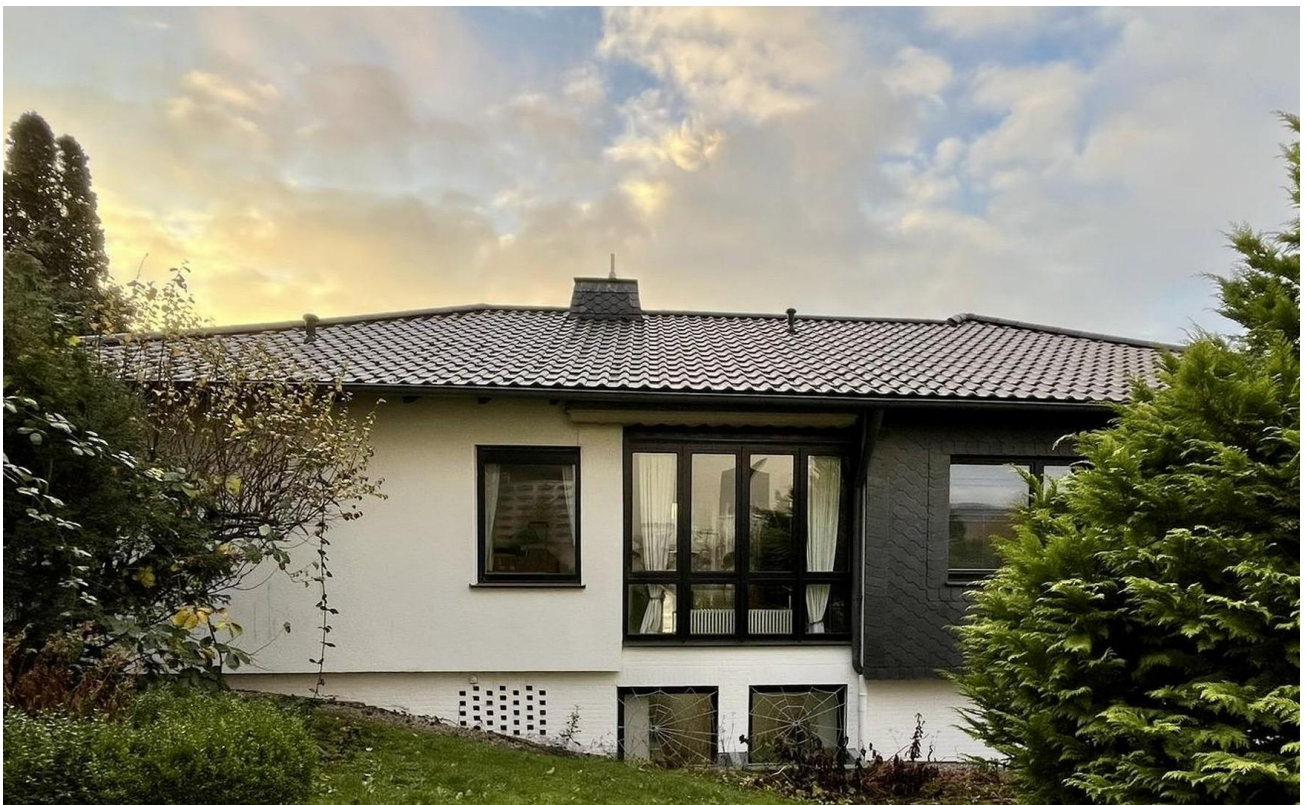
Haus außen, seitlich