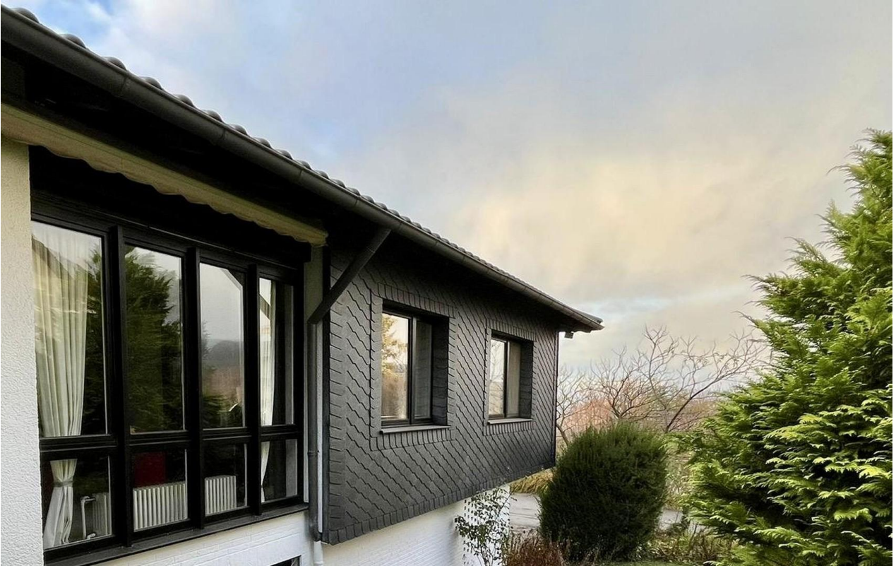
Haus außen, seitlich