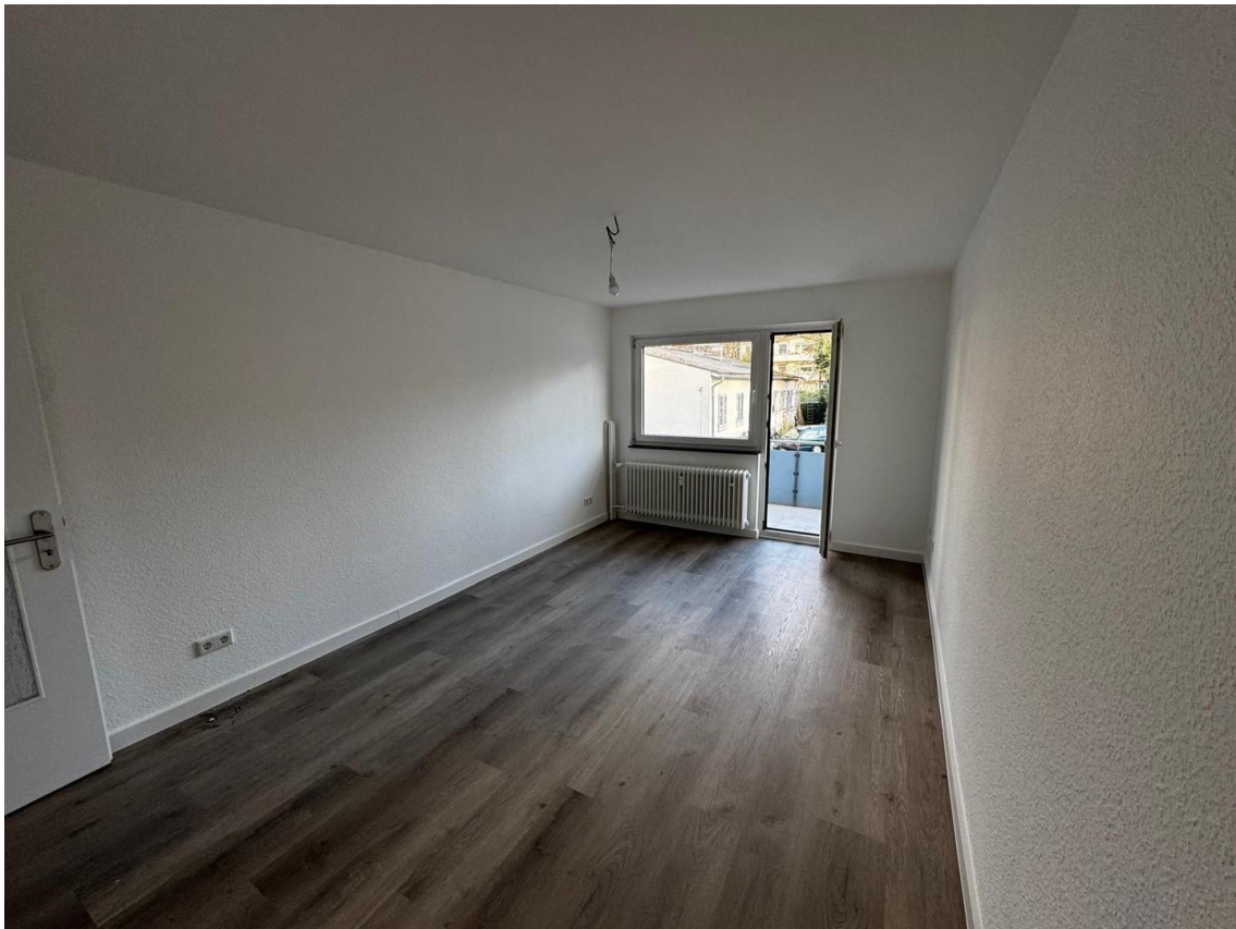
Zimmer 1 (Ost)