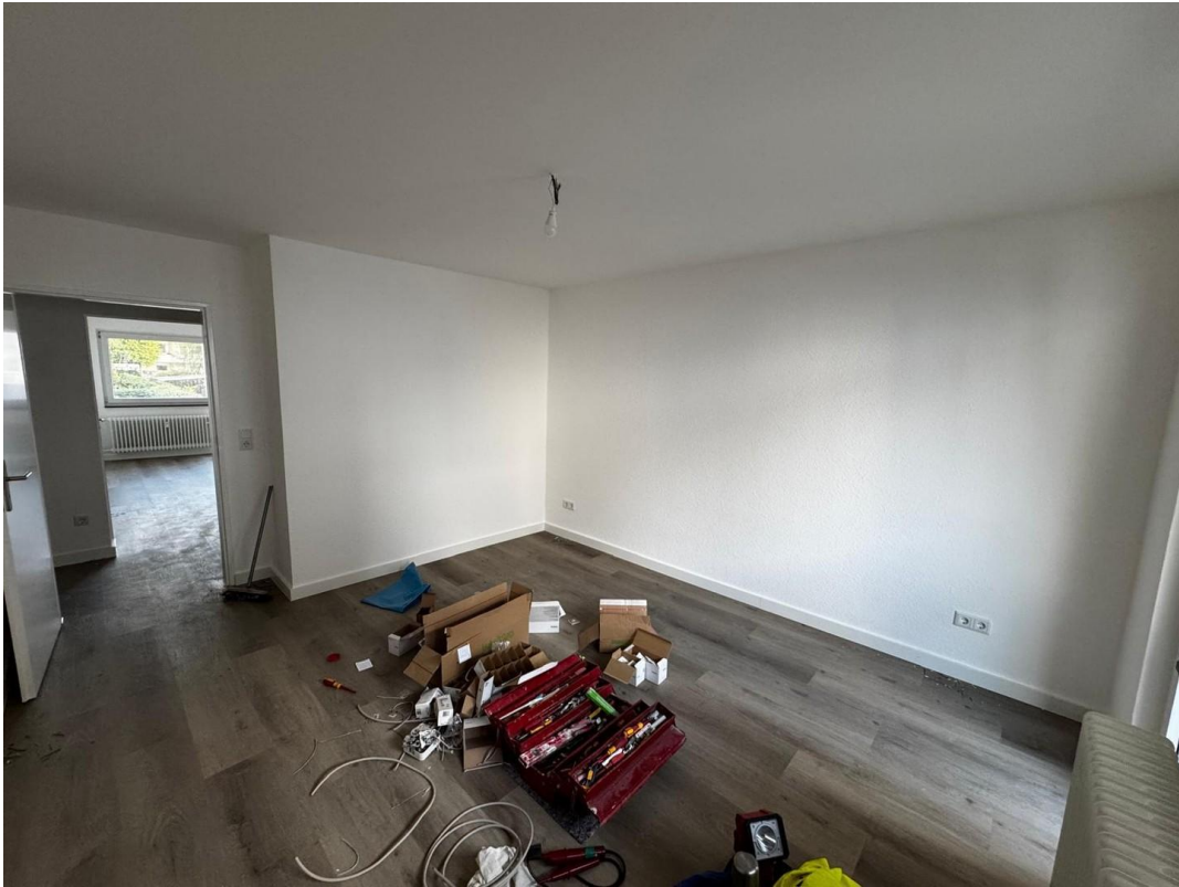
Zimmer 2 (West)