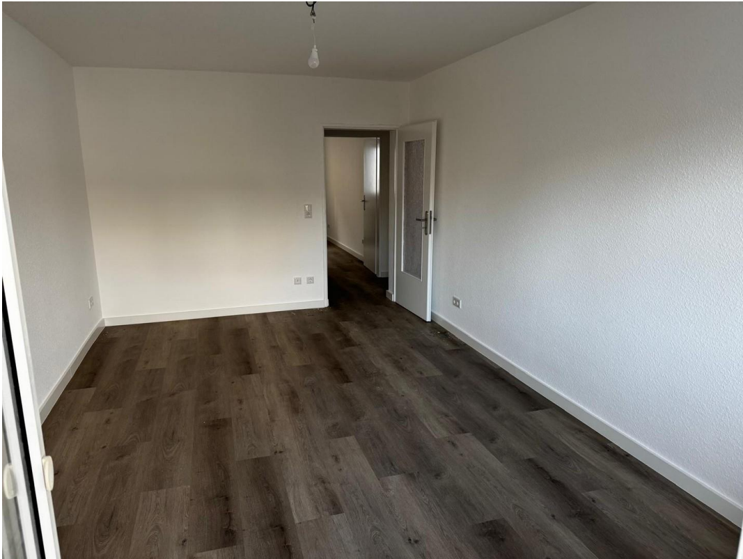
Zimmer 1 (Ost)