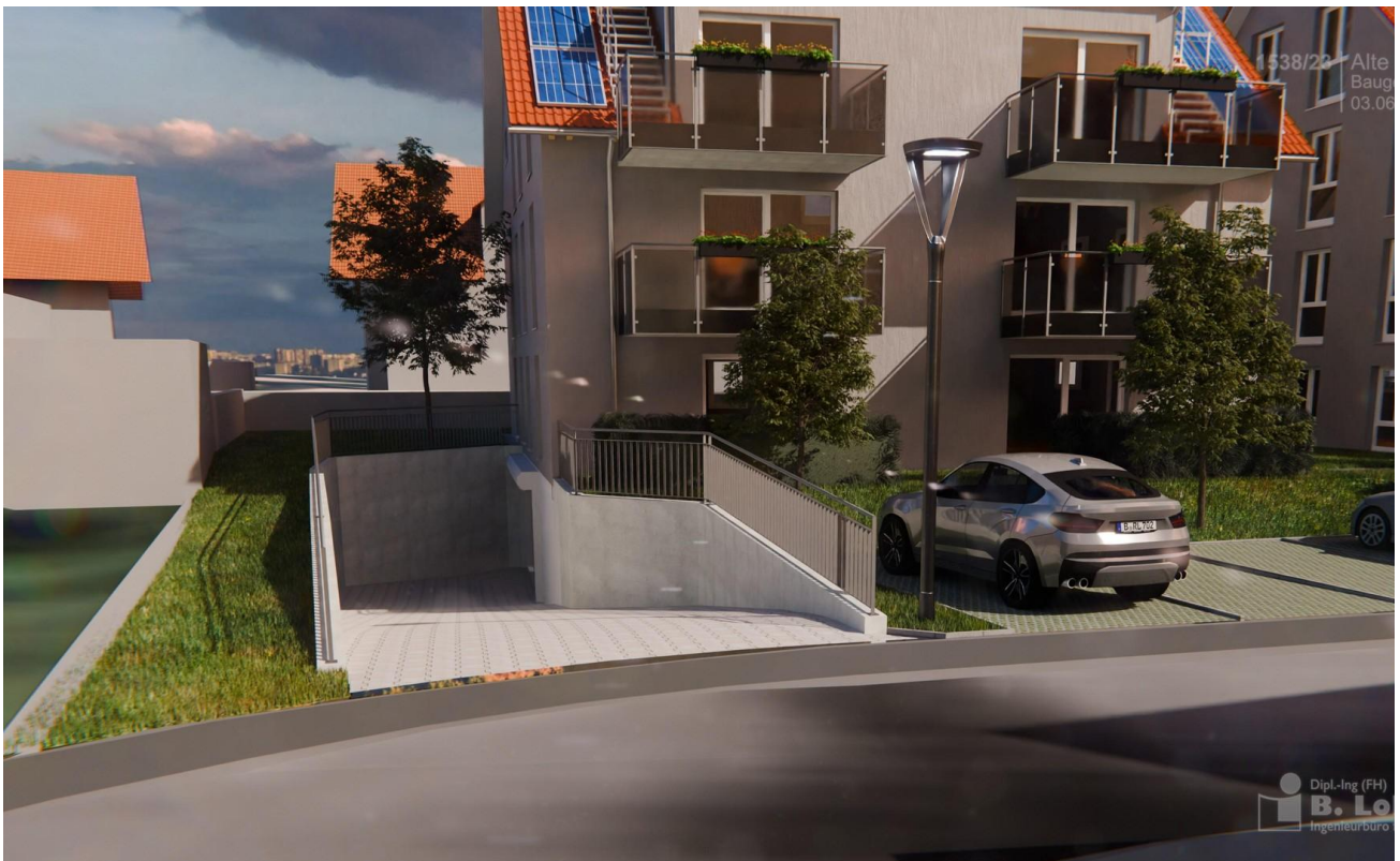
Visu TG Einfahrt