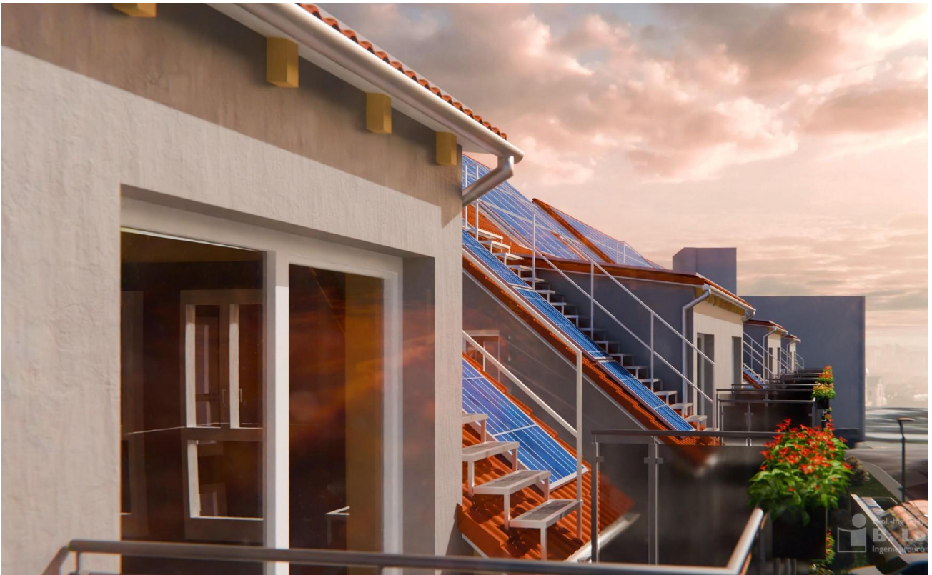
Visu Balkon DG