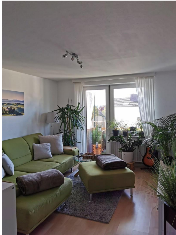
Zimmer 1 / Wohnzimmer + Balkon