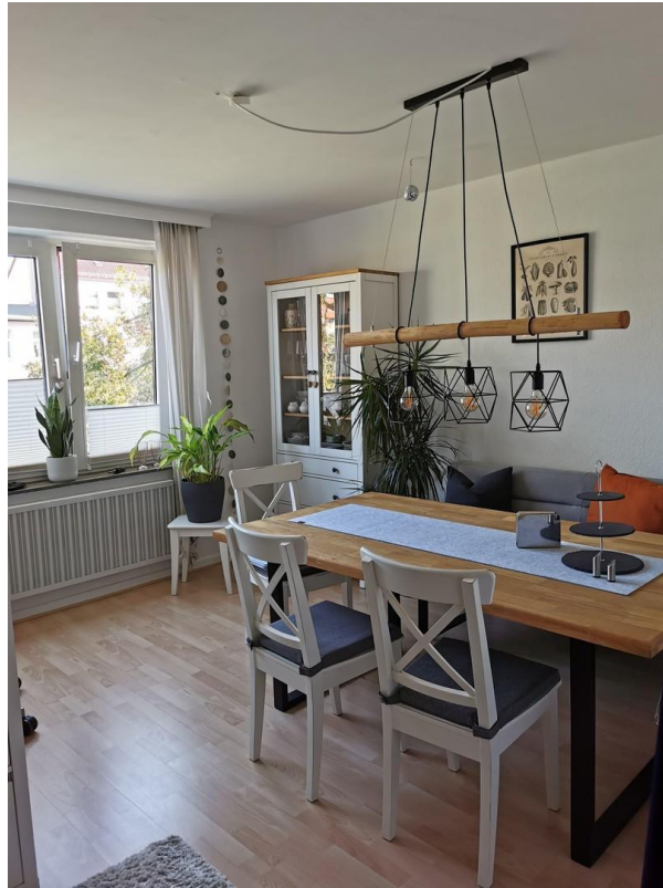
Zimmer 3 / Arbeitszimmer