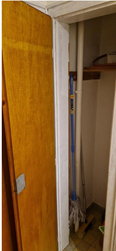
Besenkammer in der Küche