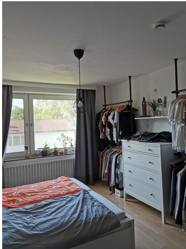
Zimmer 2 / Schlafzimmer