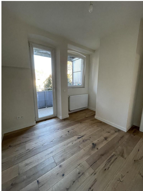
Büro / Kinderzimmer mit Balkon