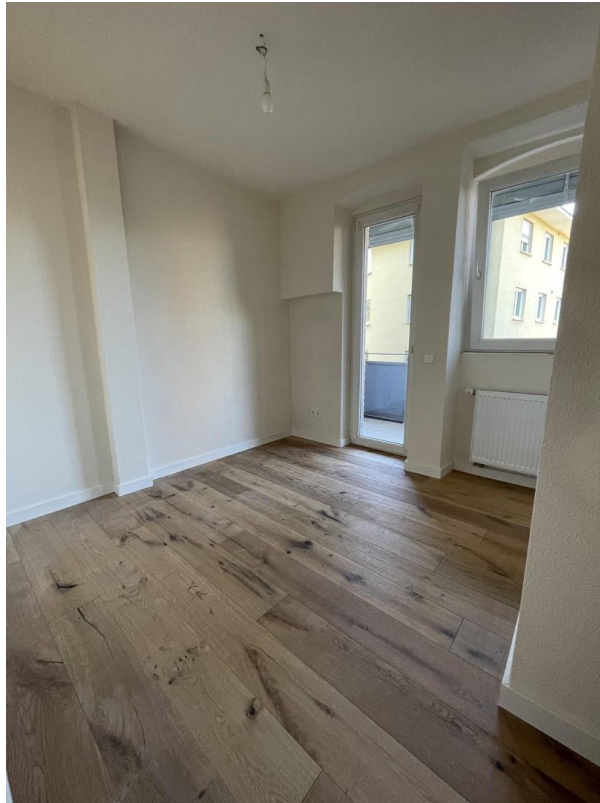
Büro / Kinderzimmer mit Balkon