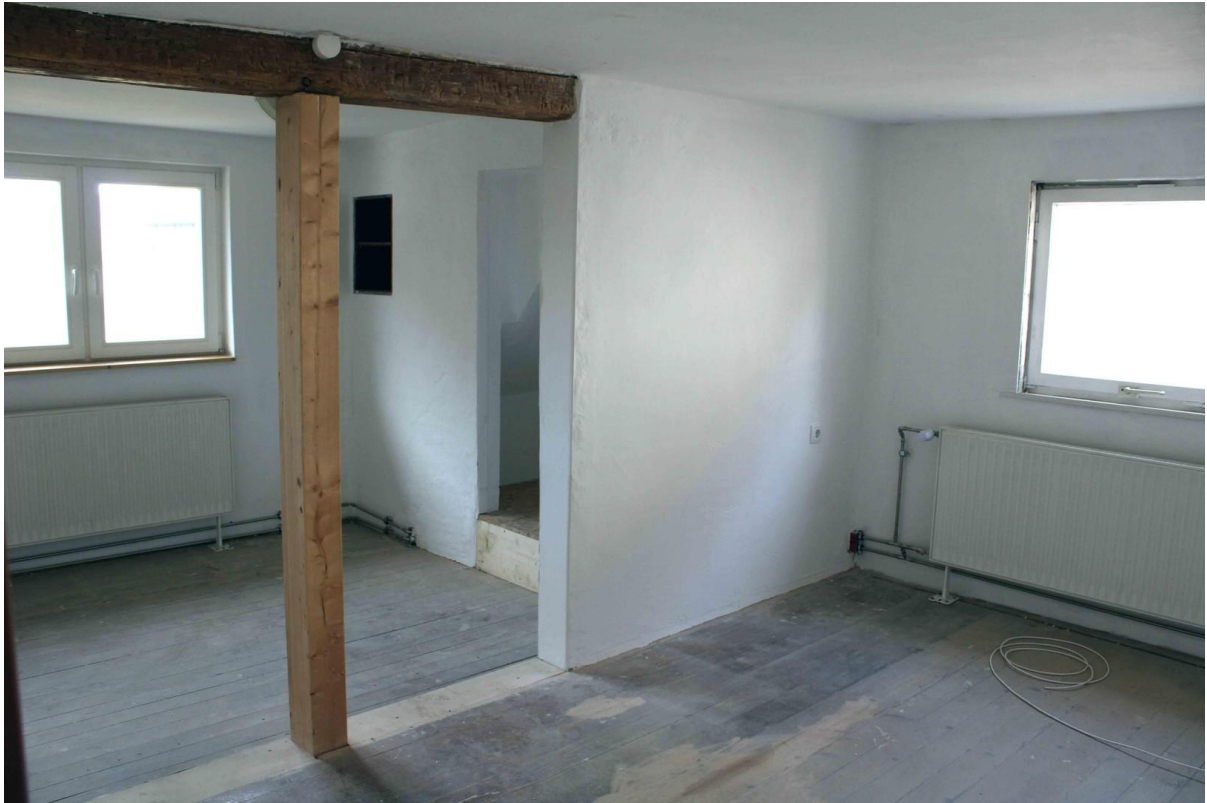
Zimmer Obergeschoss Westseite