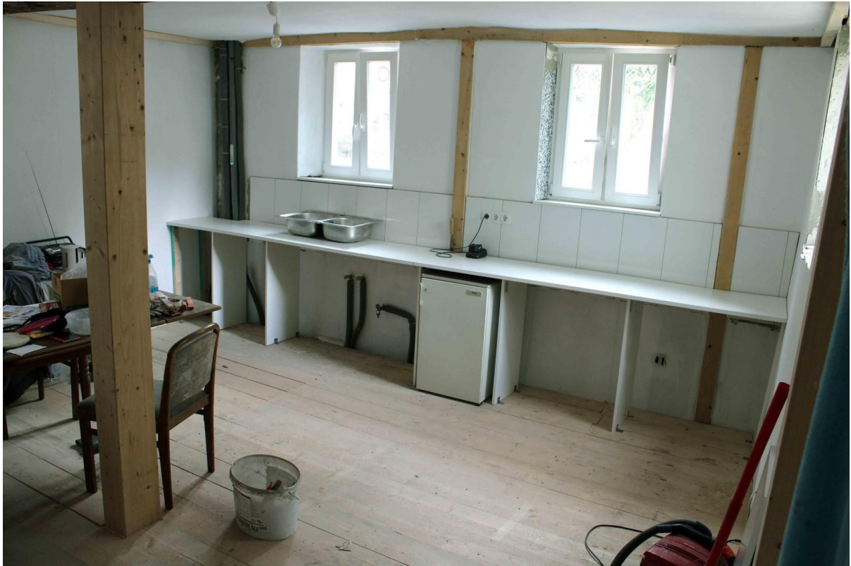
Wohnküche fast fertig