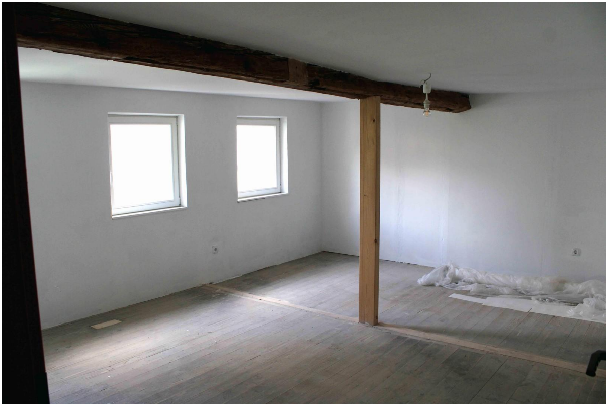
Zimmer Obergeschoss Ostseite