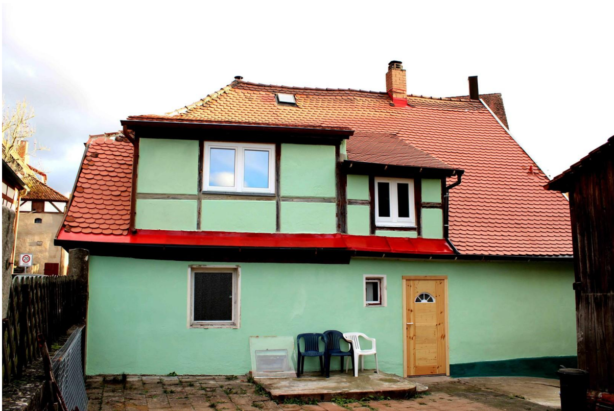
Westseite mit neuer Dachdeckung