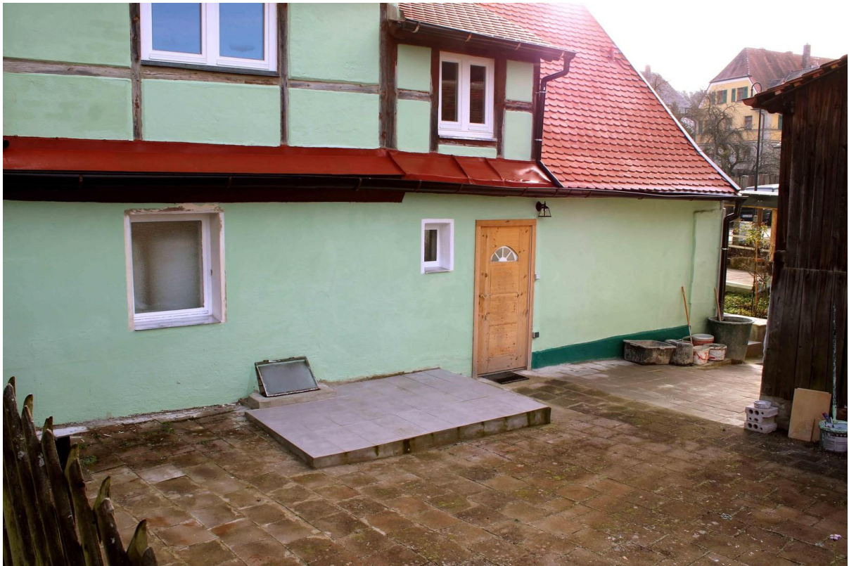
Westseite mit Terrasse