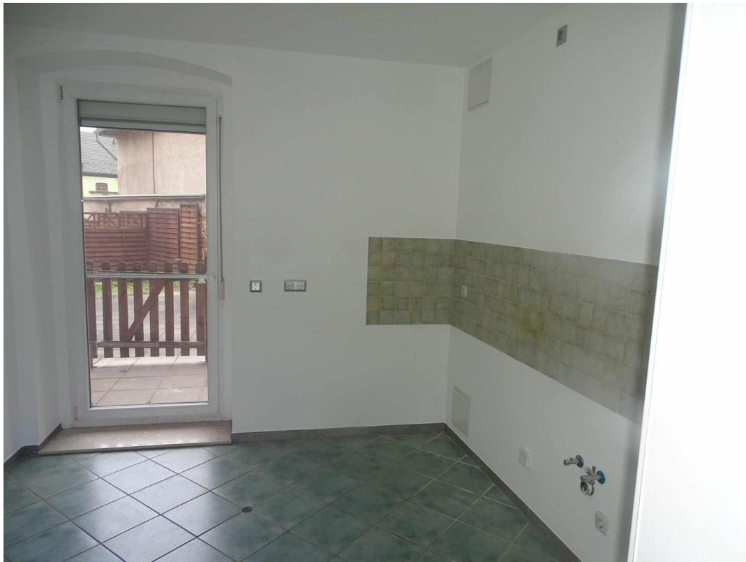
Küche zur Terrasse