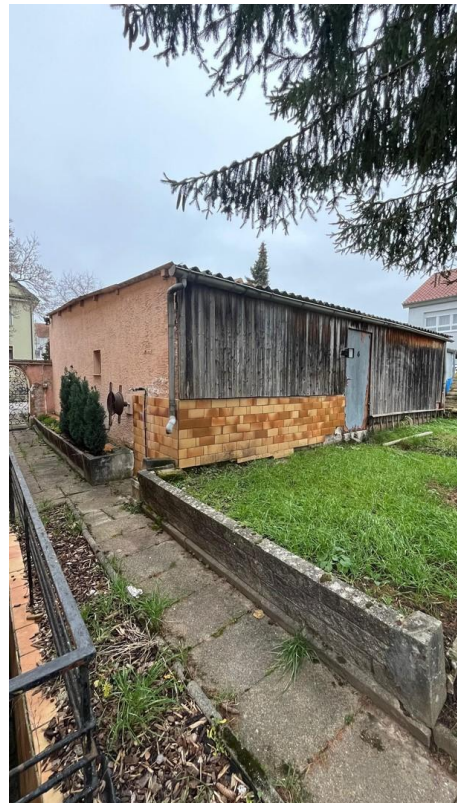
Garage und Werkraum Außen