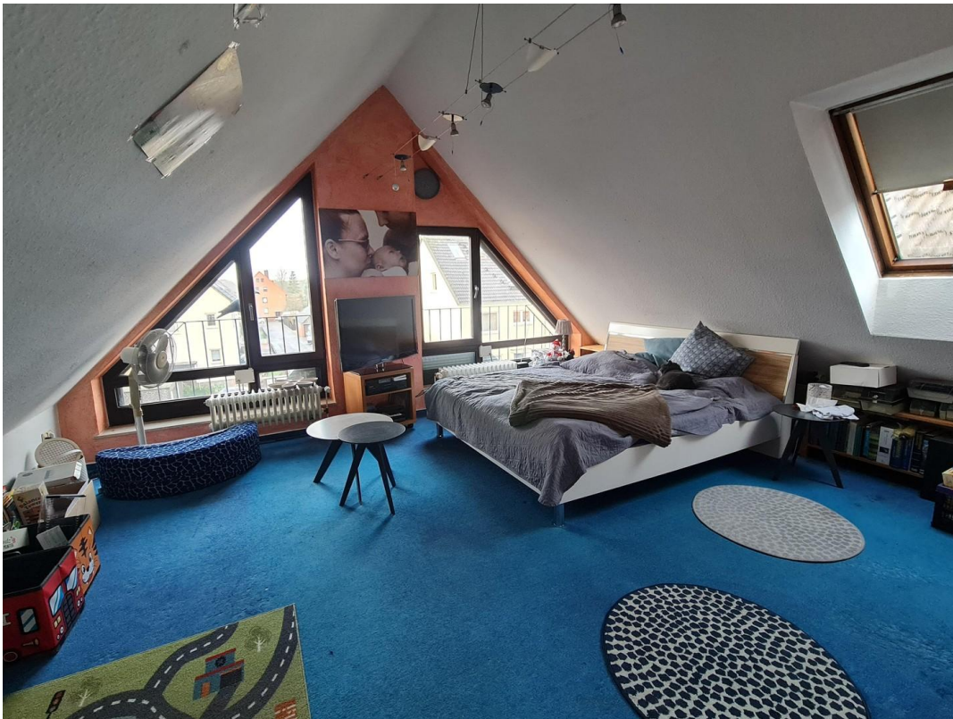
Studiozimmer im Dachgeschoss