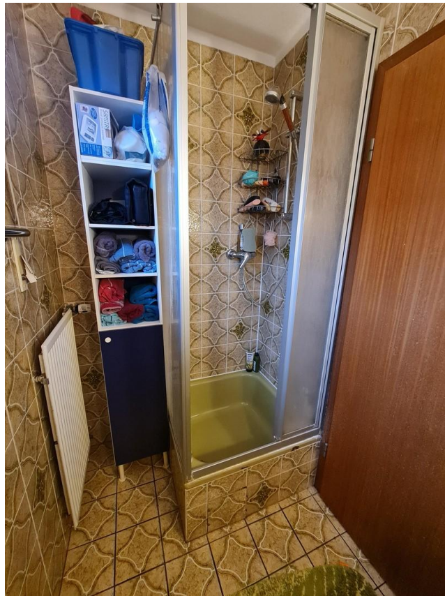
Dusche im Gästebad