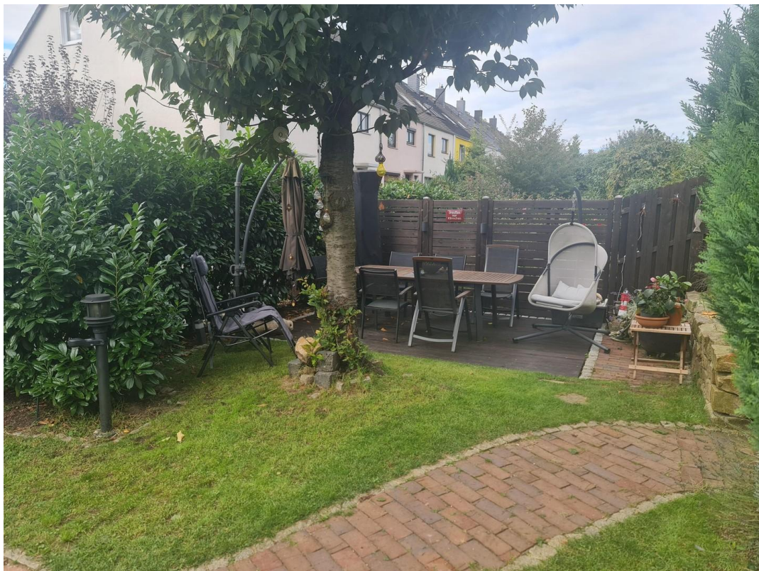
Untere Terrasse von der Seite