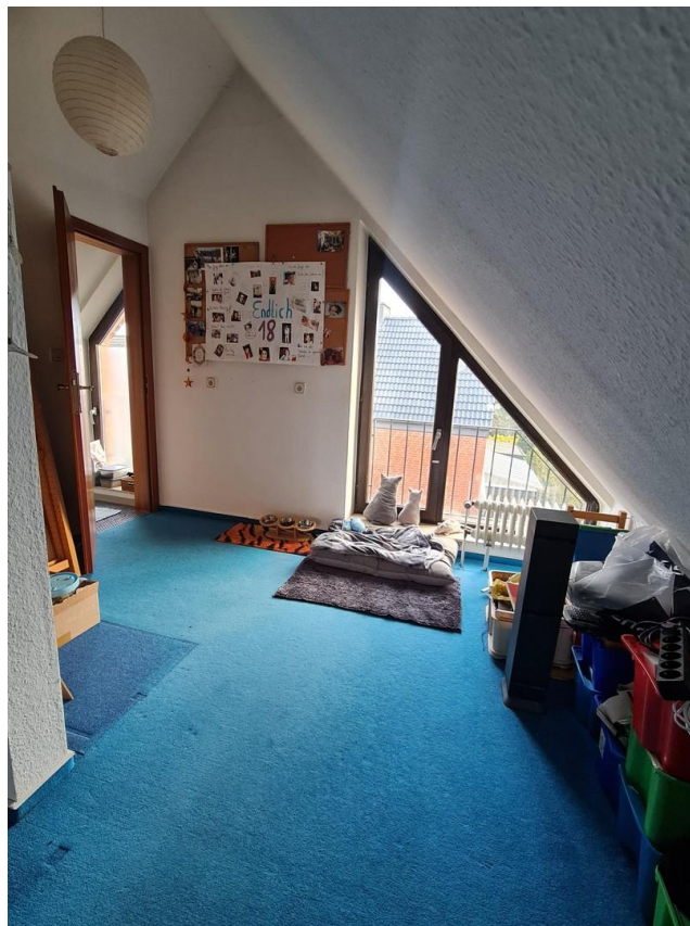
Dachgeschoss nach vorn