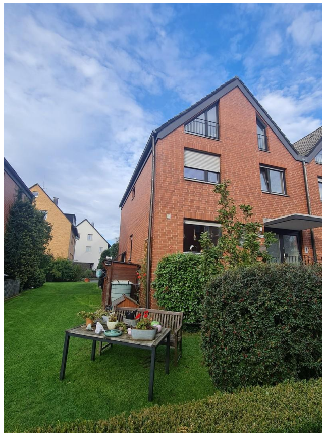
Vorderansicht mit Garten