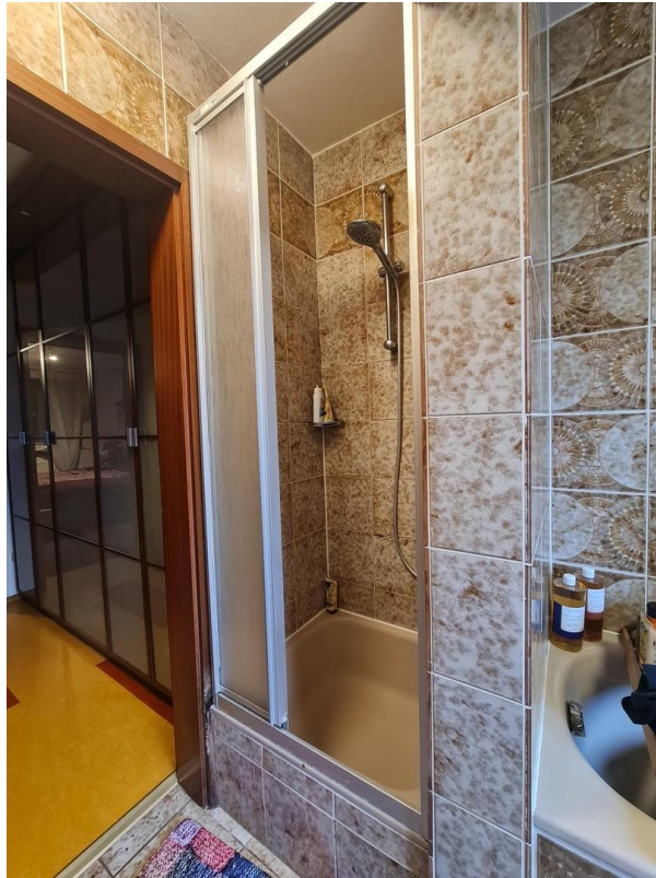
Dusche im Badezimmer