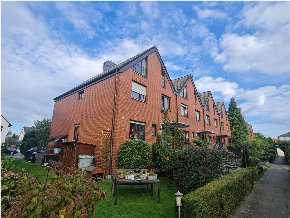
Vorderansicht ganzer Block