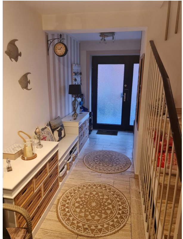
Flur mit Blick auf Haustür