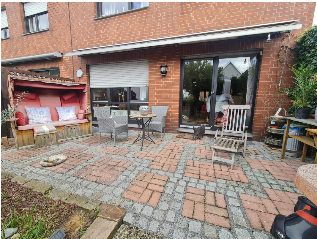
Terrasse oben, Westseite