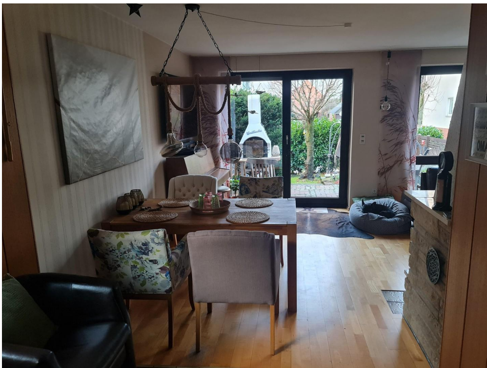
Essbereich, Blick auf Terrasse