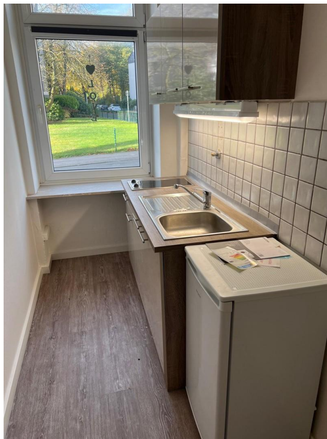
neue Küche mit Küchenzeile