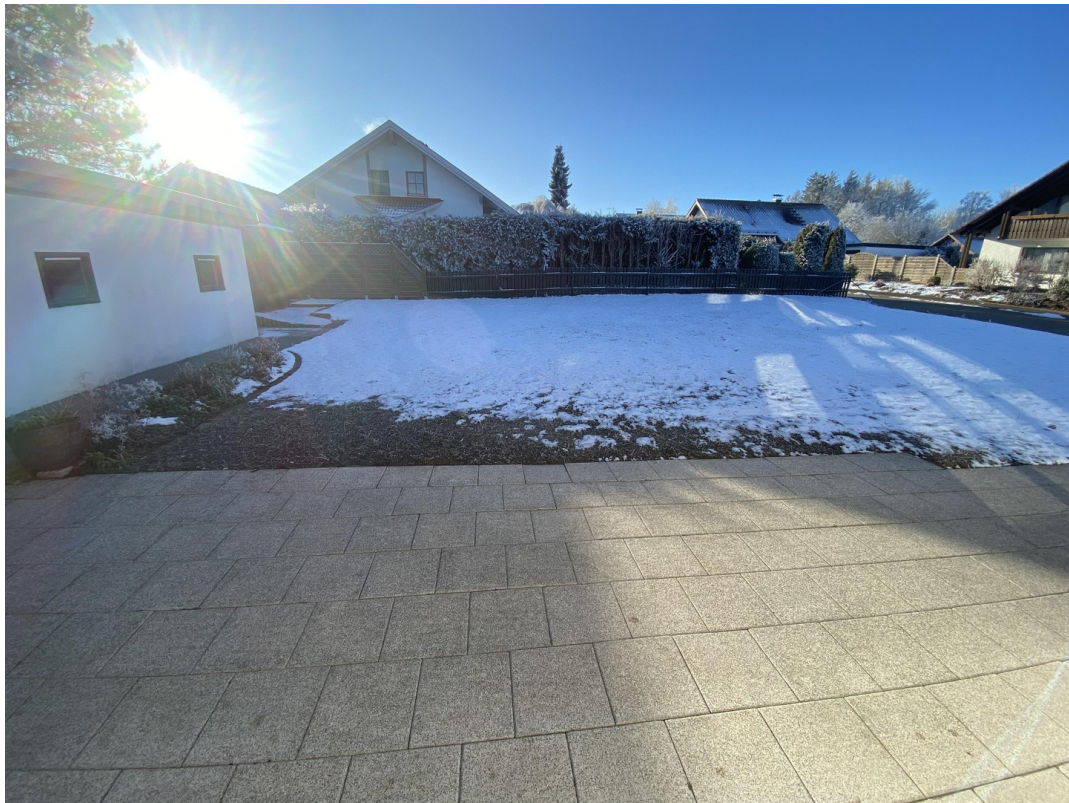
Terrasse, Garage, Garten