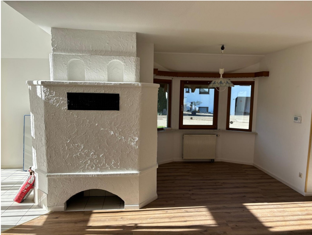
Warmluftofen mit Erker