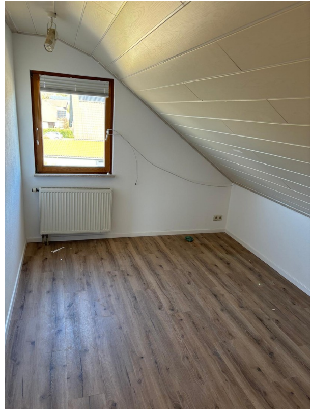
Zimmer OG zur Anliegerstraße