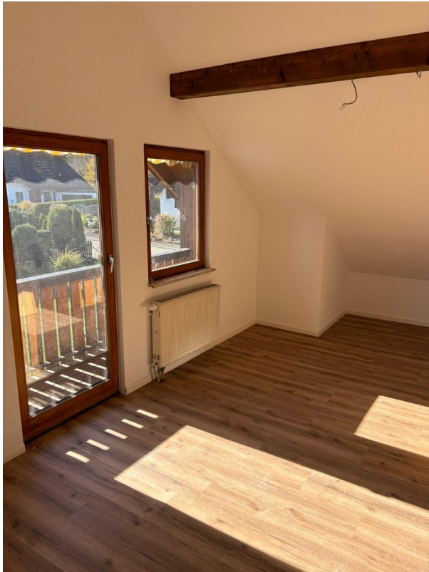
Zimmer OG mit Balkon