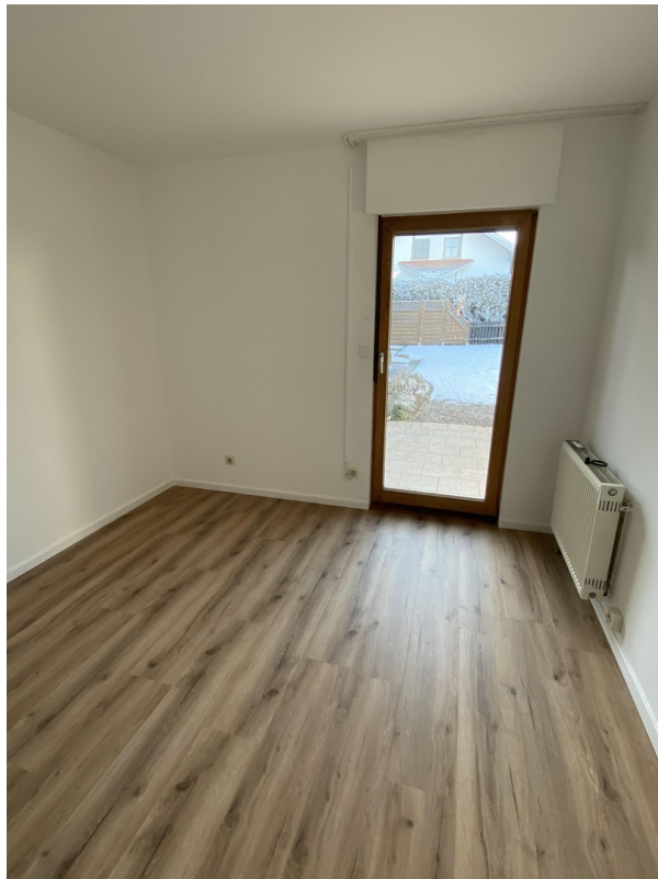
Zimmer EG zum Garten