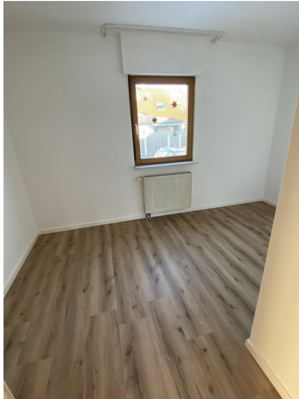
Zimmer EG zur Anliegerstraße