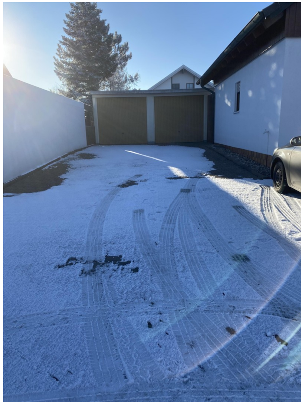
Garage und Stellplätze