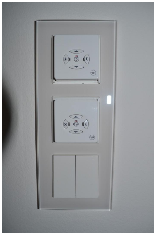
Bedienelemente und Schalter