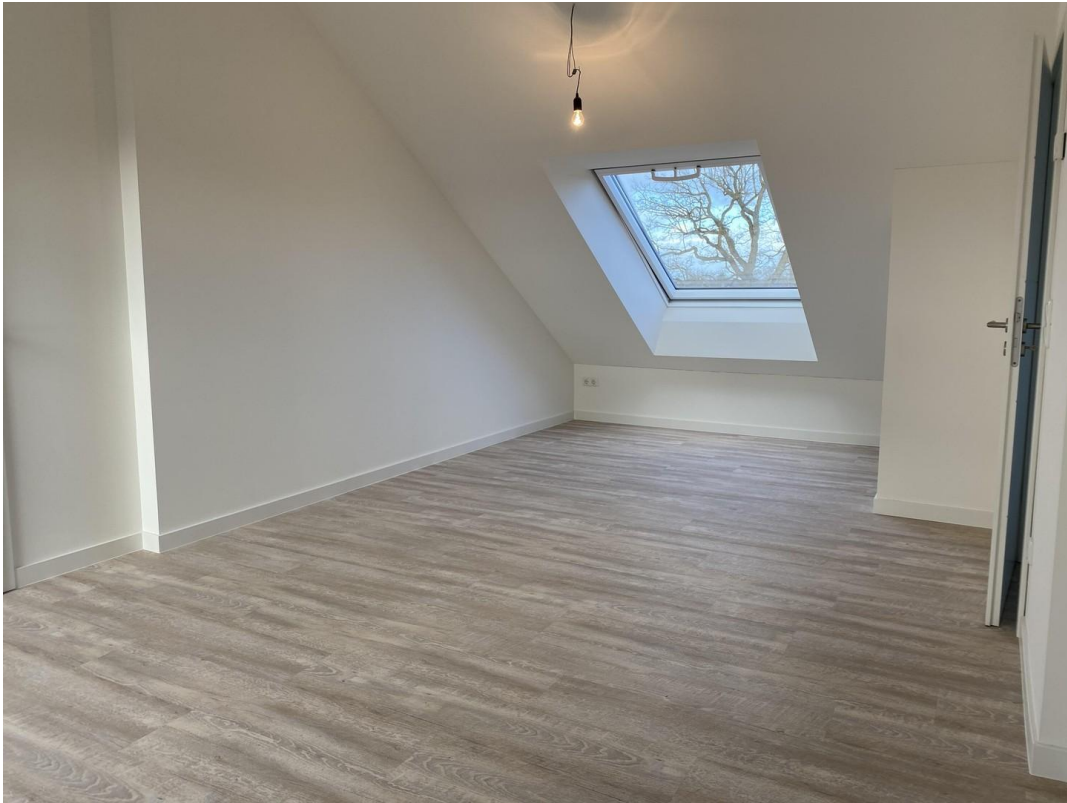
großes Zimmer oben