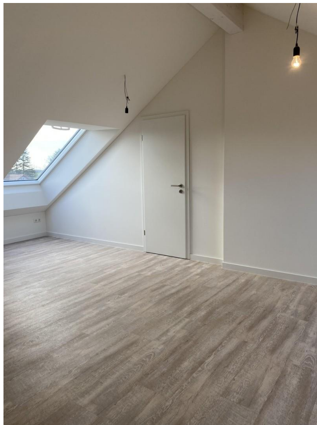
großes Zimmer oben