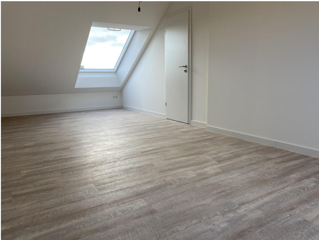
großes Zimmer oben