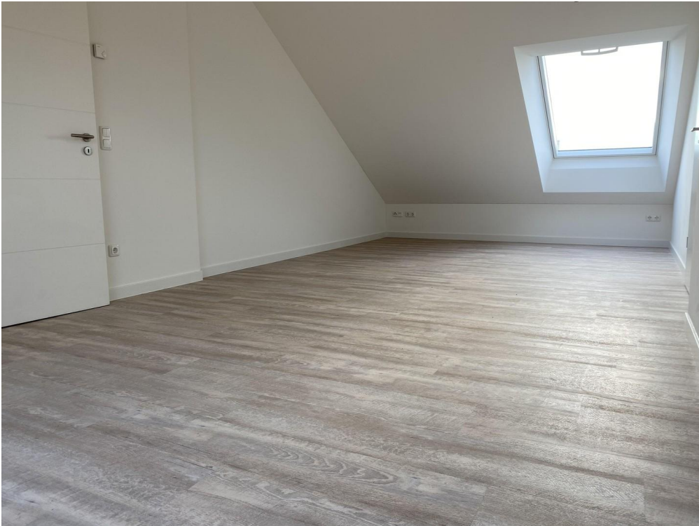
großes Zimmer oben