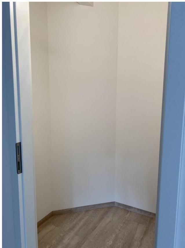
Abstellraum unter der Treppe