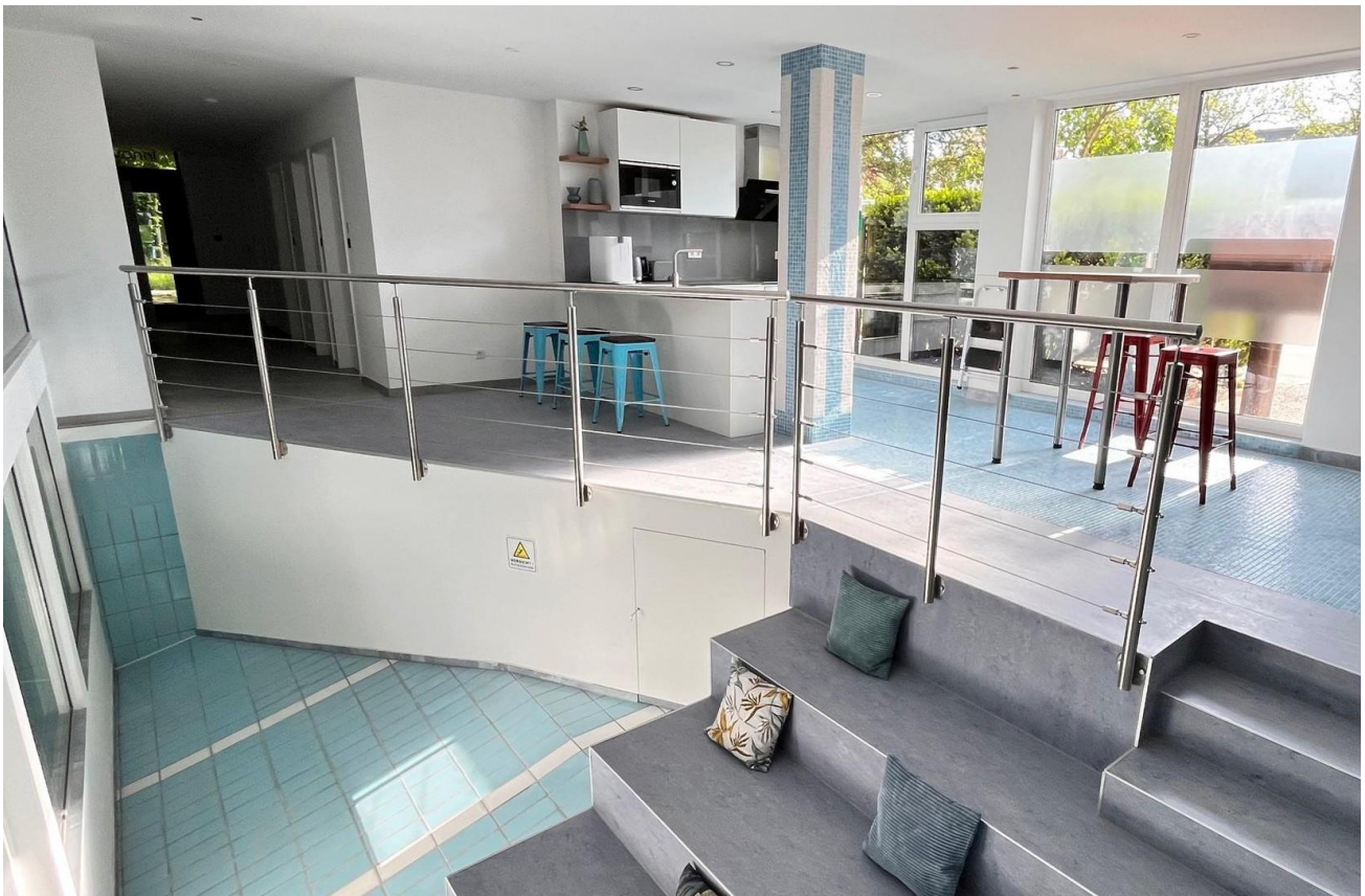
Innovativ - einmaliges Konzept