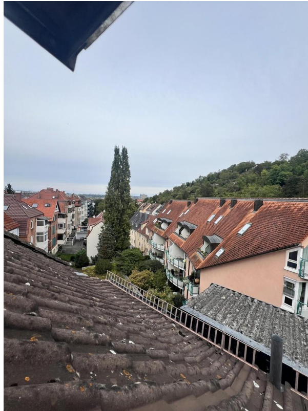
Blick aus dem Dachspitz