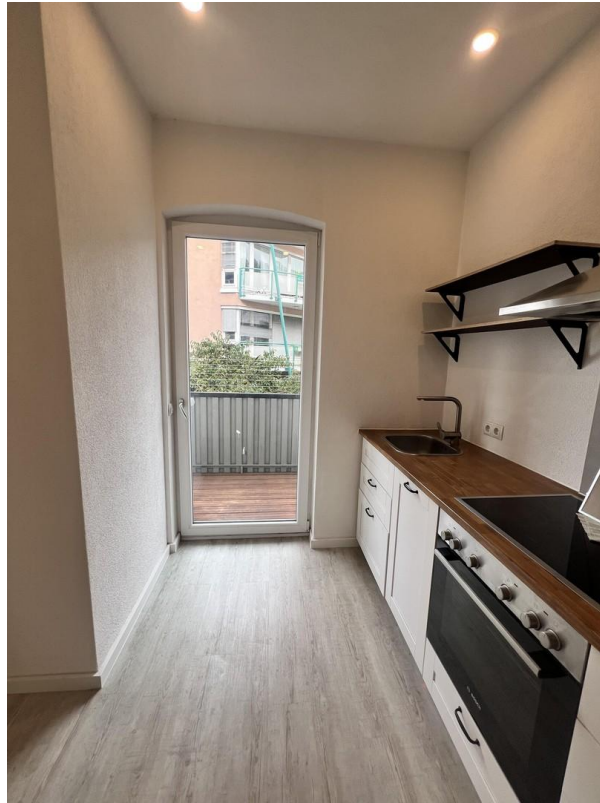
Blick auf Balkontür