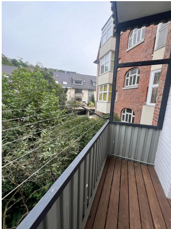
Blick vom Balkon im ersten OG