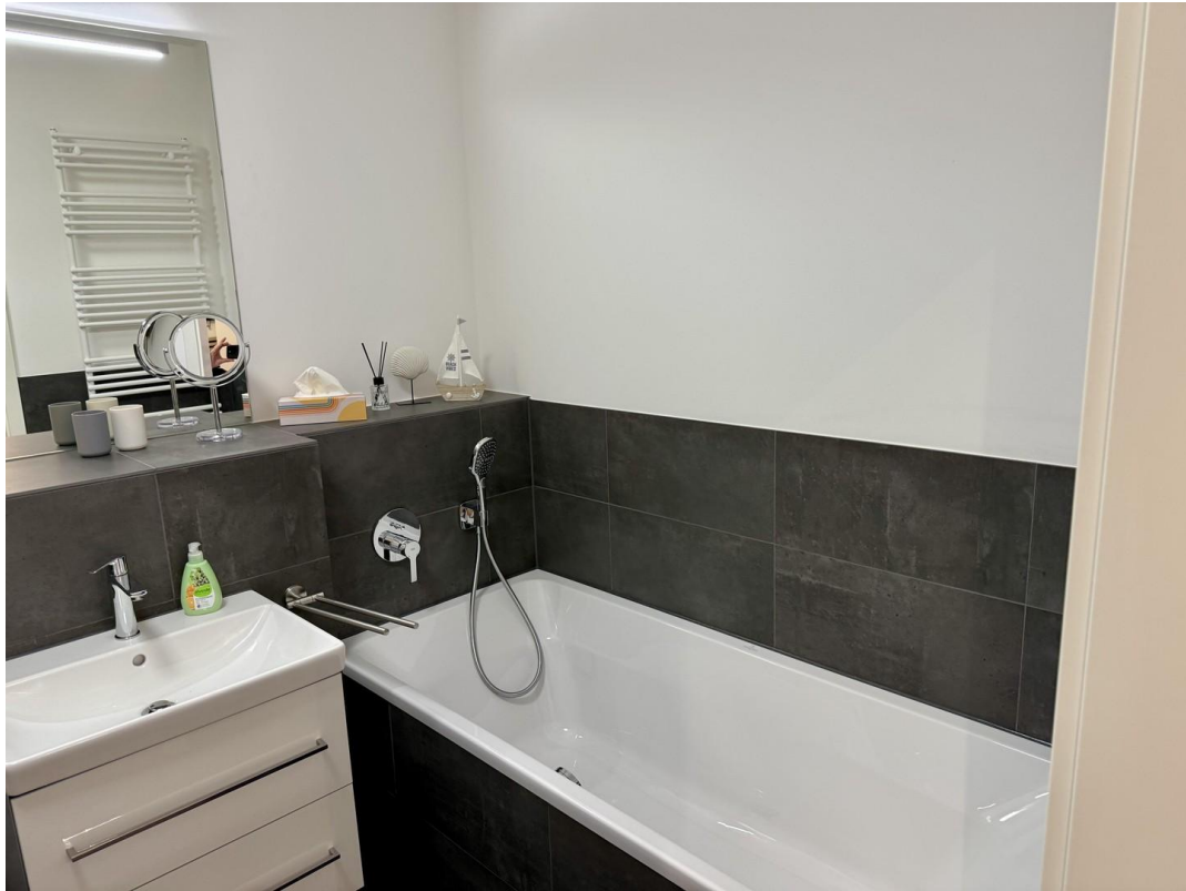
Badzimmer mit Wanne