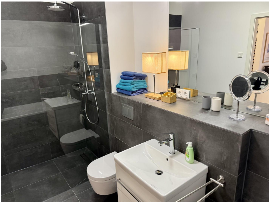
Badezimmer mit Wellness-Dusche