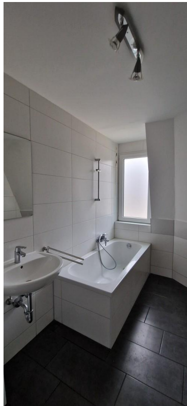
Tageslichtbad mit Badewanne