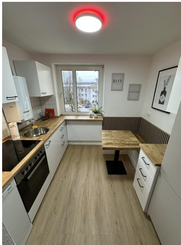
Küche inkl. Spülmaschine