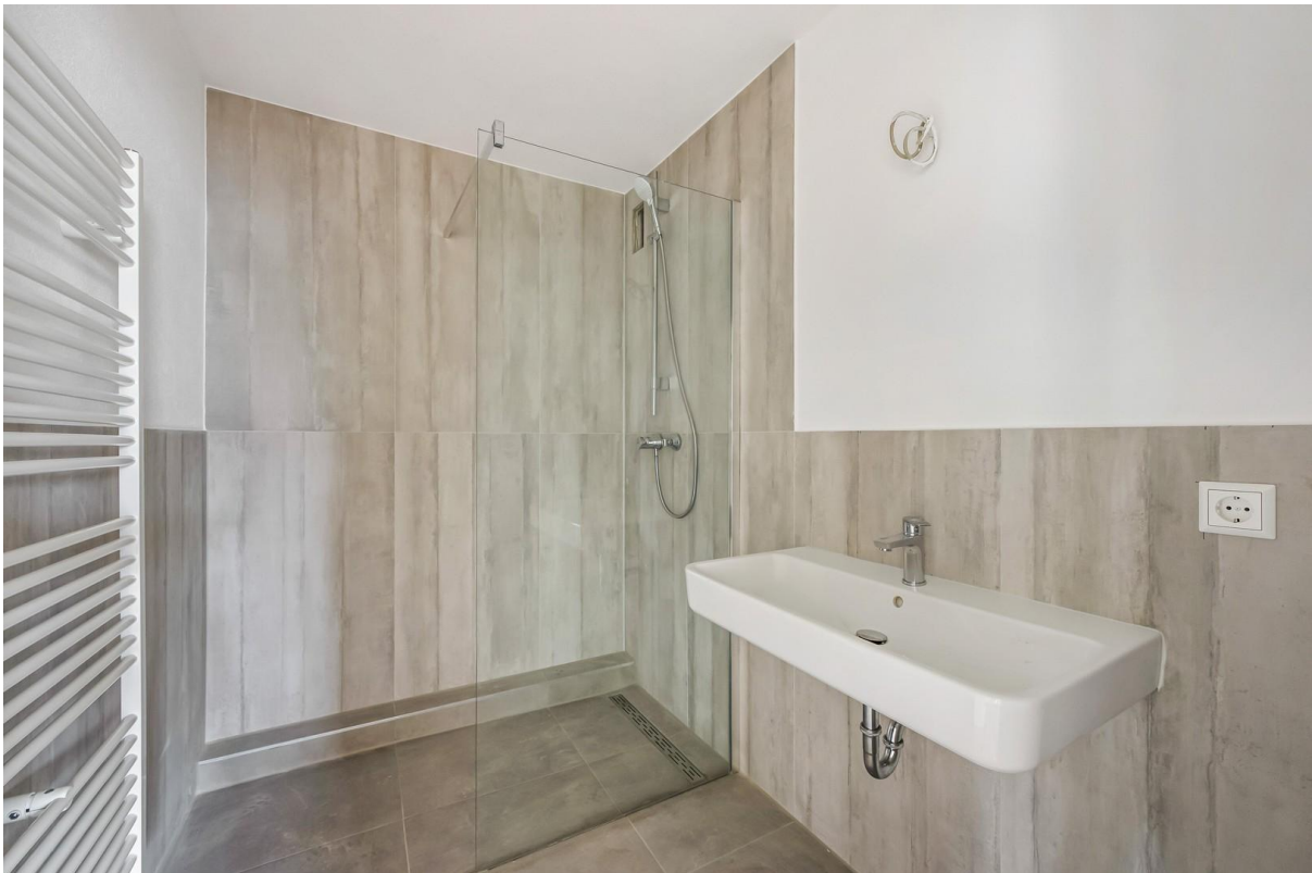
Bad - Heizkörper/Waschbecken