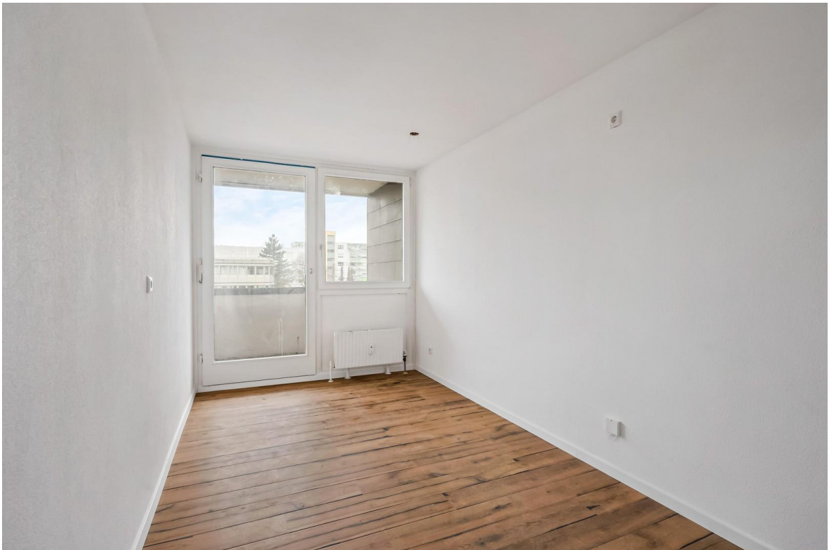
Küche - Zugang Balkon