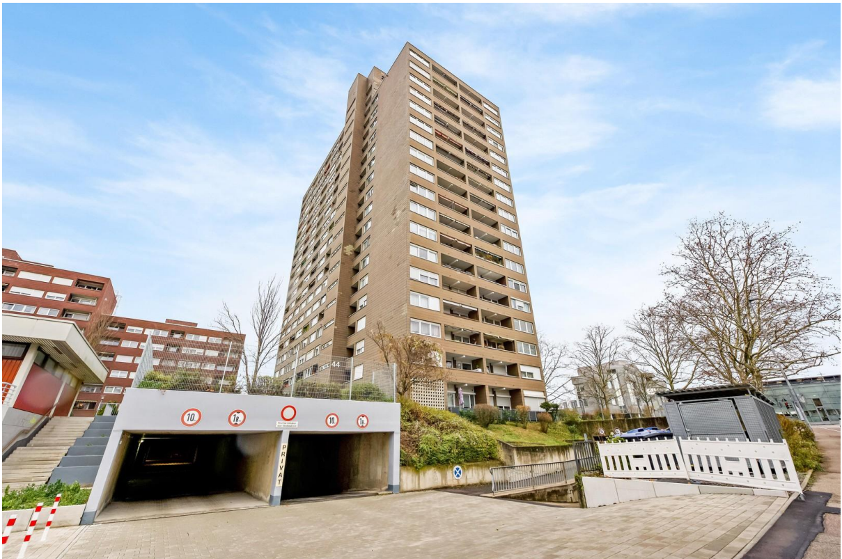
Ansicht Haus - Zugang TG