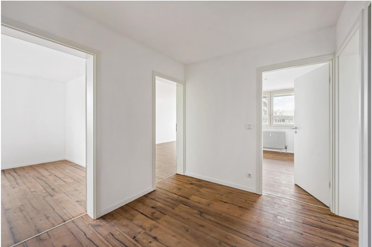
Flur - Ansicht Zugang Zimmer