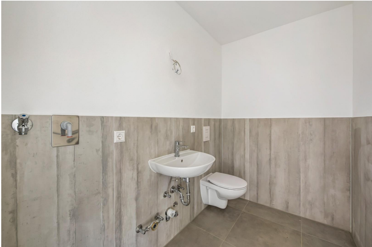
WC mit Waschmaschinenanschluss