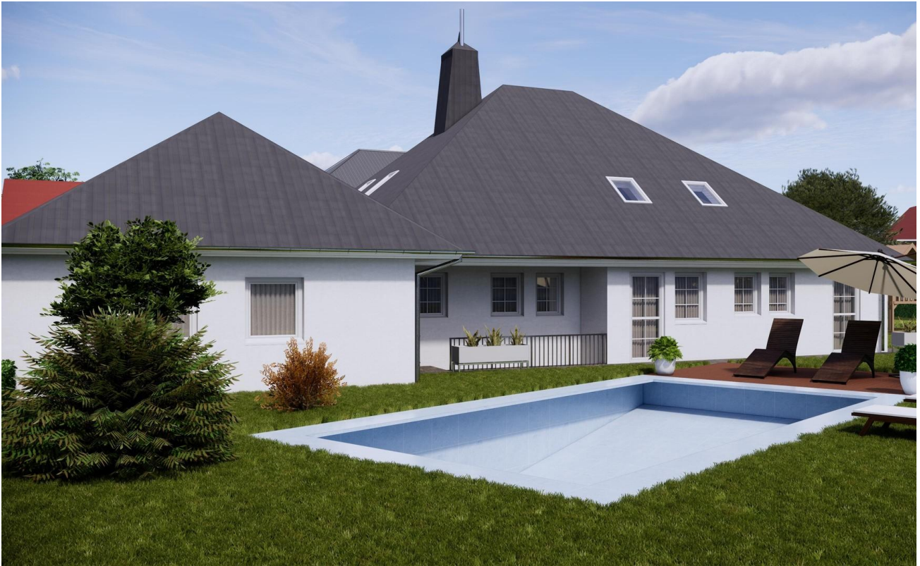
Garten Ansicht hinten, vor Küc