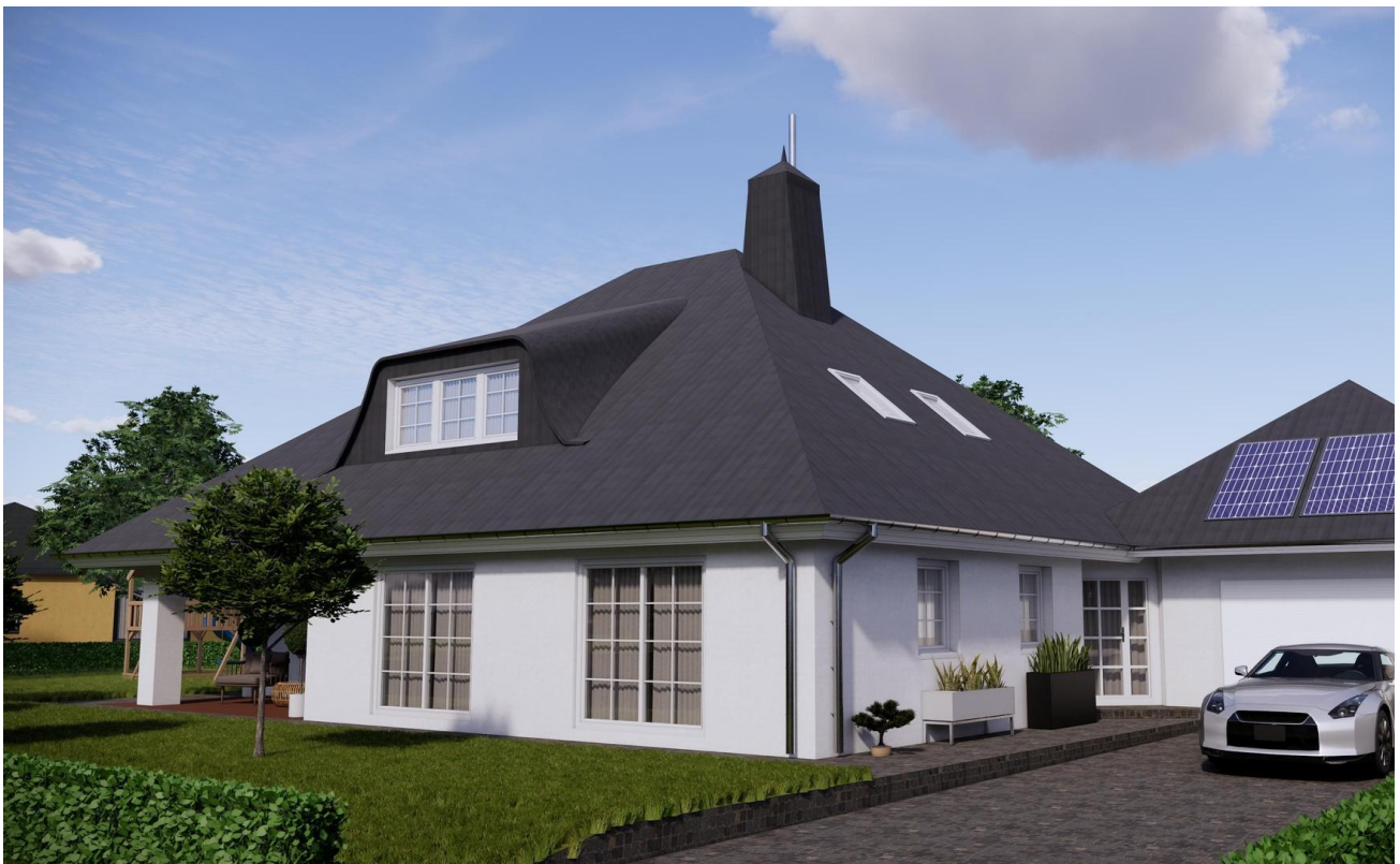
Strassen Ansicht Einfahrt