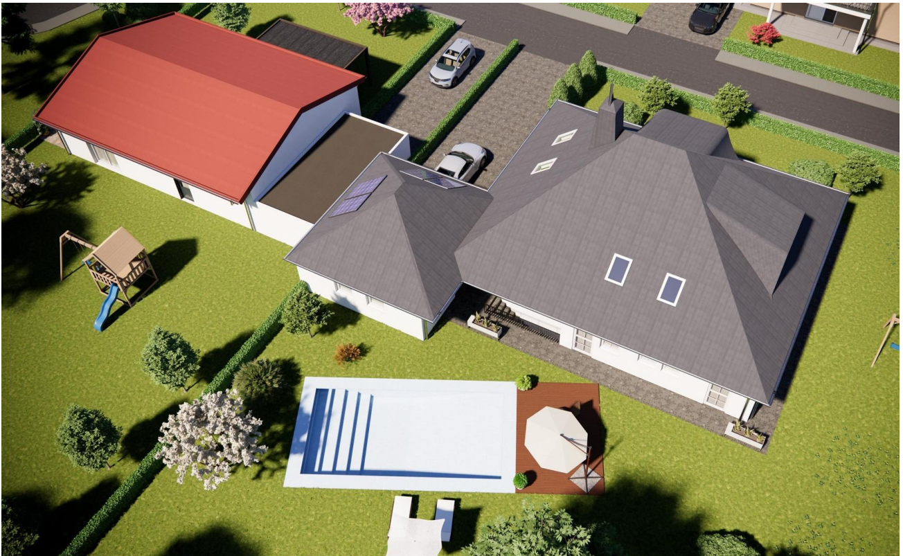
Ansicht von oben Garten hinten