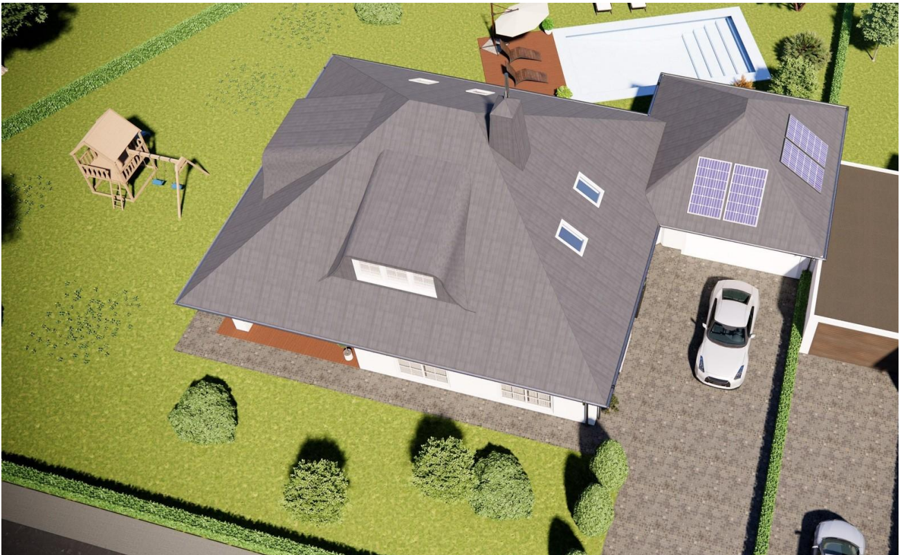
Ansicht von oben Einfahrt