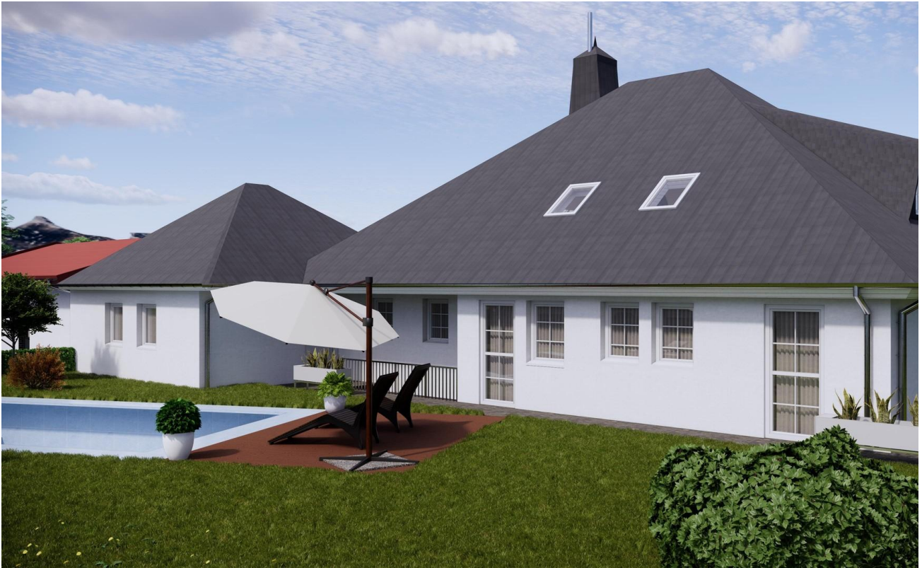
Haus Garten hinten