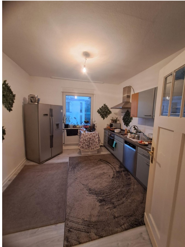
Sanierungsstandard Bsp. 1.OG