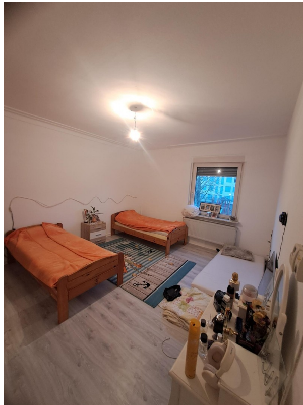
Sanierungsstandard Bsp. 1.OG