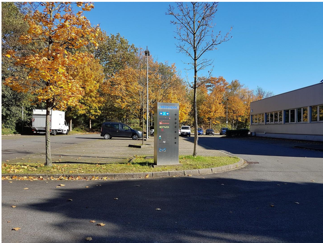
Einfahrt und Parkplätze