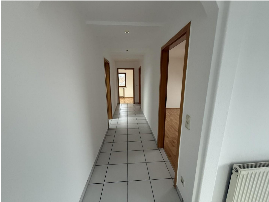
Flur zu Schlafzimmern