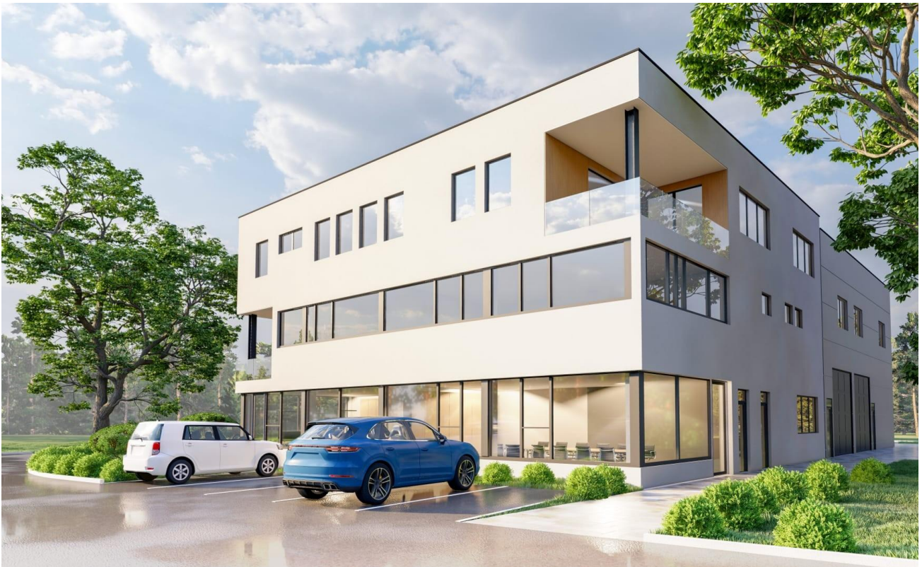
Bürogebäude Nord-West Ansicht