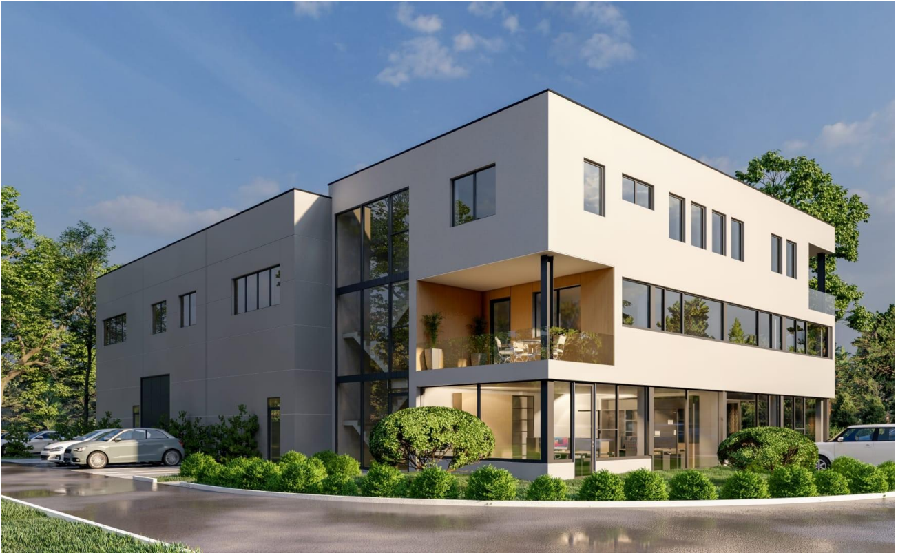
Bürogebäude Nord-Ost Ansicht