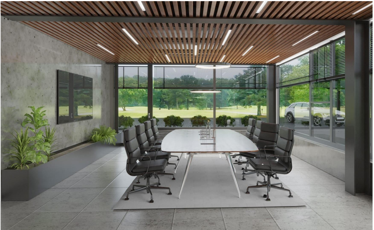
Besprechungsraum oder Büro