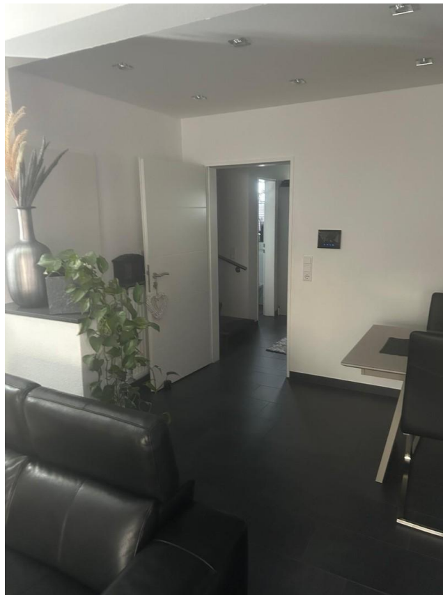
Flur zum Wohnzimmer