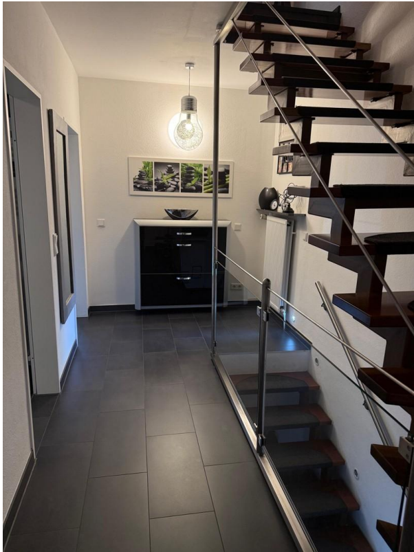
Flur 1. Etage