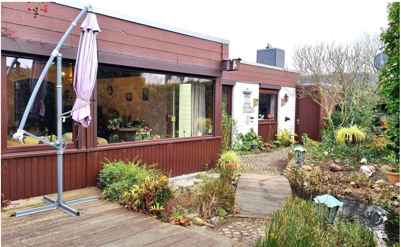
Hausansicht von Terrasse