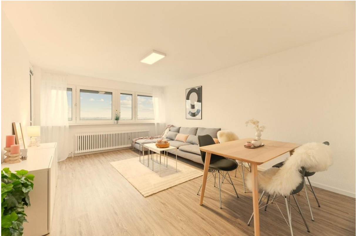
Wohnzimmer mit Essecke