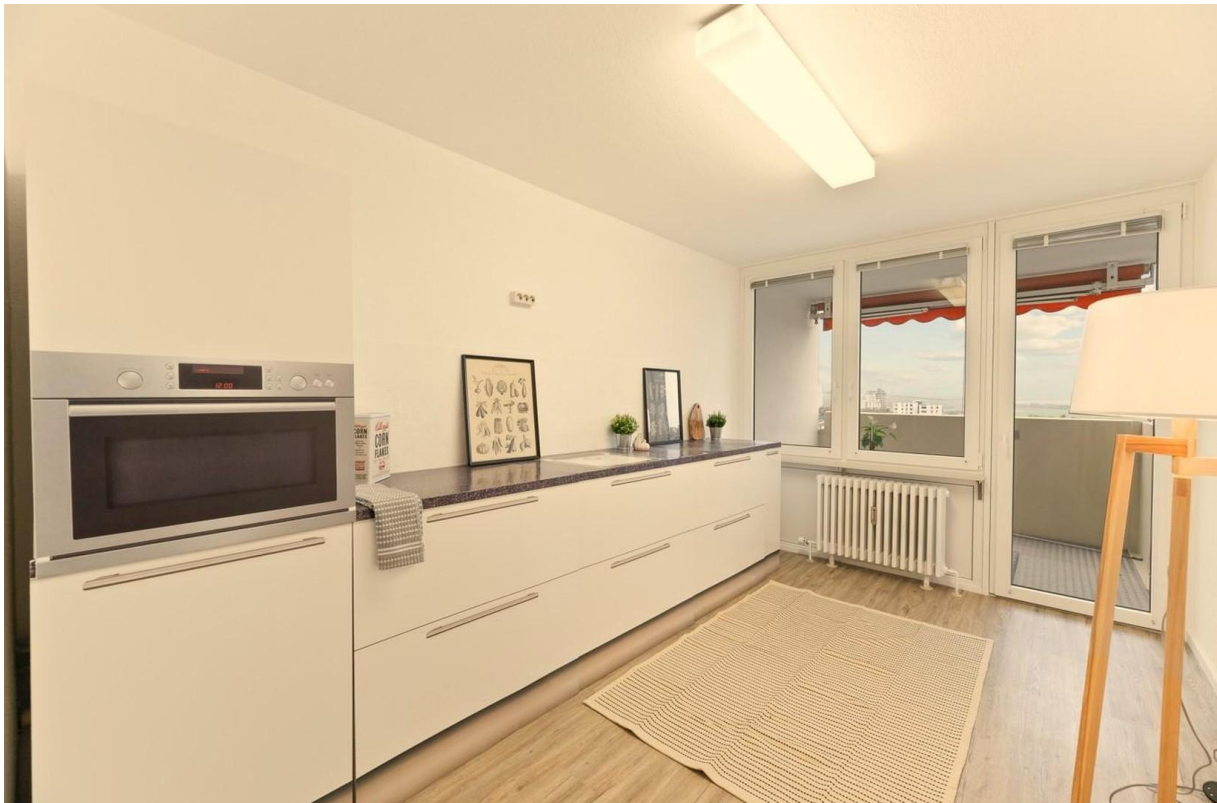
Küche mit Platz