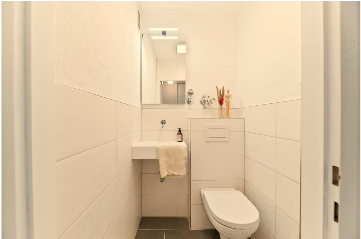
Toilette für sich