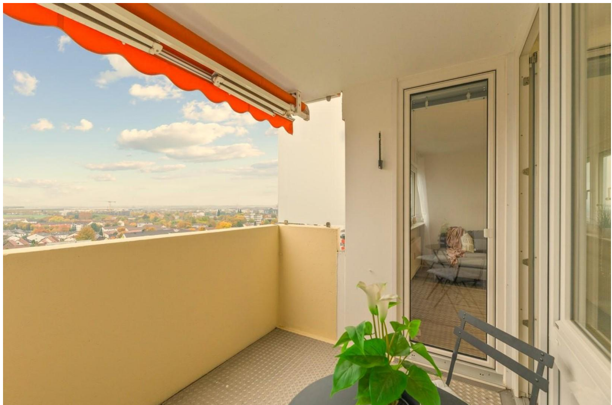
Balkon mit Traumblick