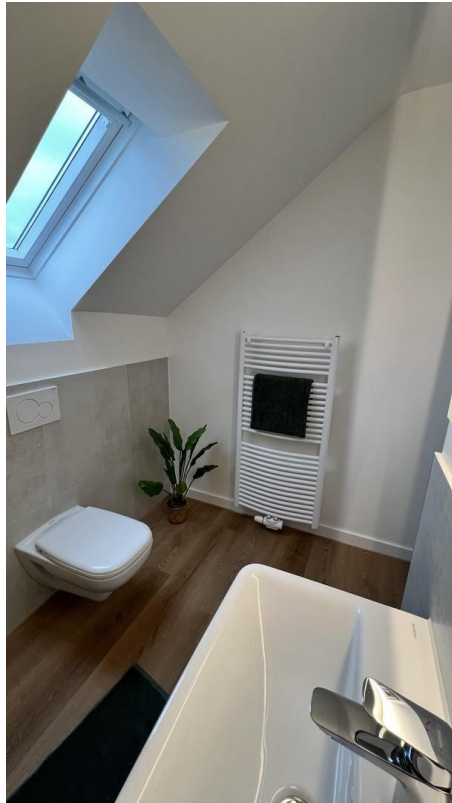
Fenster & Handtuchheizkörper