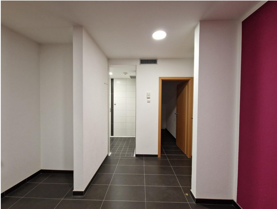
Hobbyraum mit Abstellraum