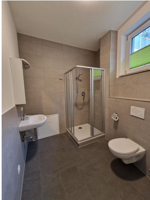
Tageslichtbad mit Dusche u. WC