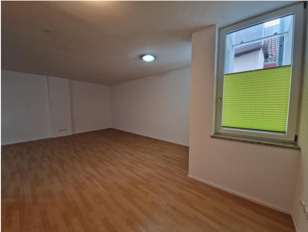
Blick in den Essbereich