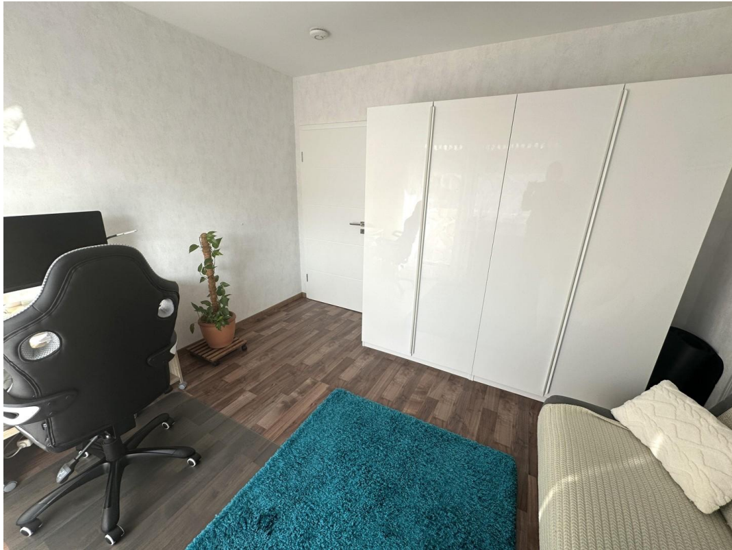
Arbeitszimmer / Kinderzimmer