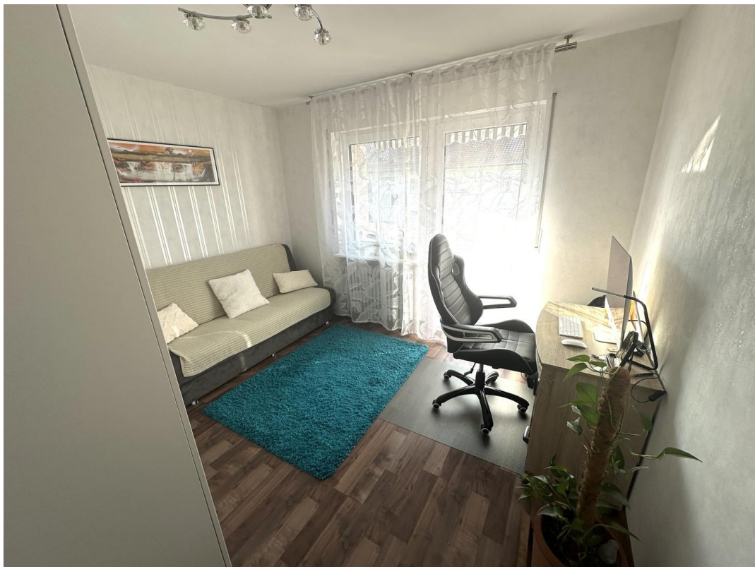
Arbeitszimmer / Kinderzimmer