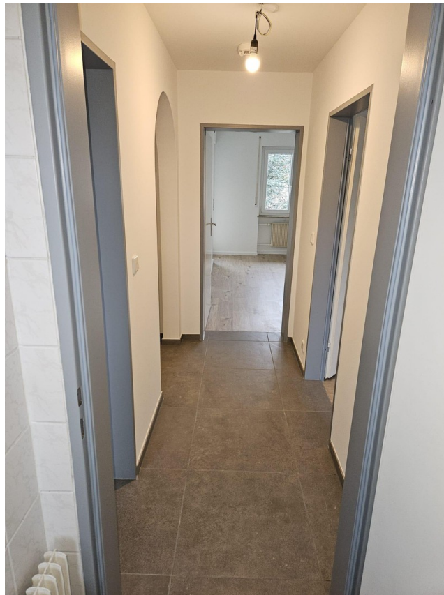
Flur (Sicht von WC)