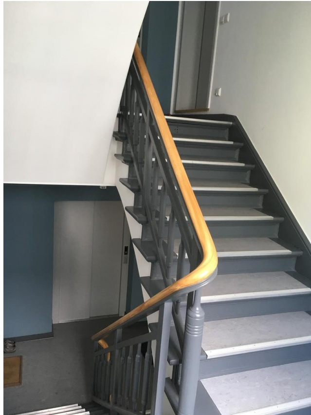
Treppenaufgang und Aufzug