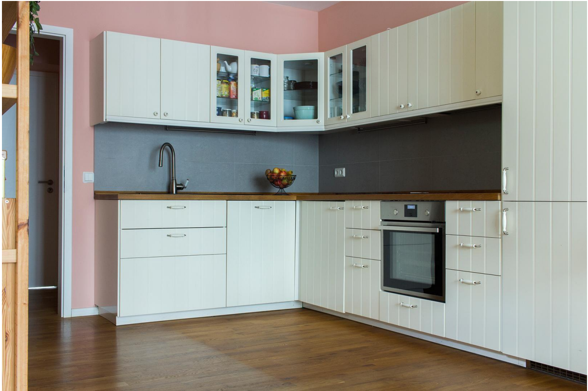
Einbauküche mit Induktionsherd