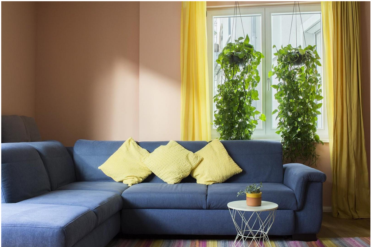
Wohnzimmer mit Sofa