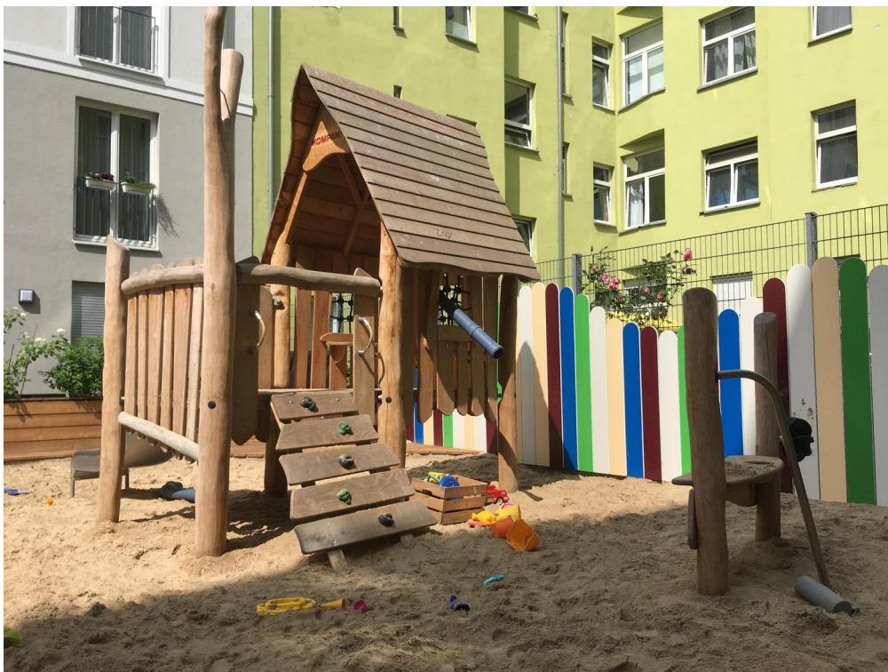
Spielplatz im Hof