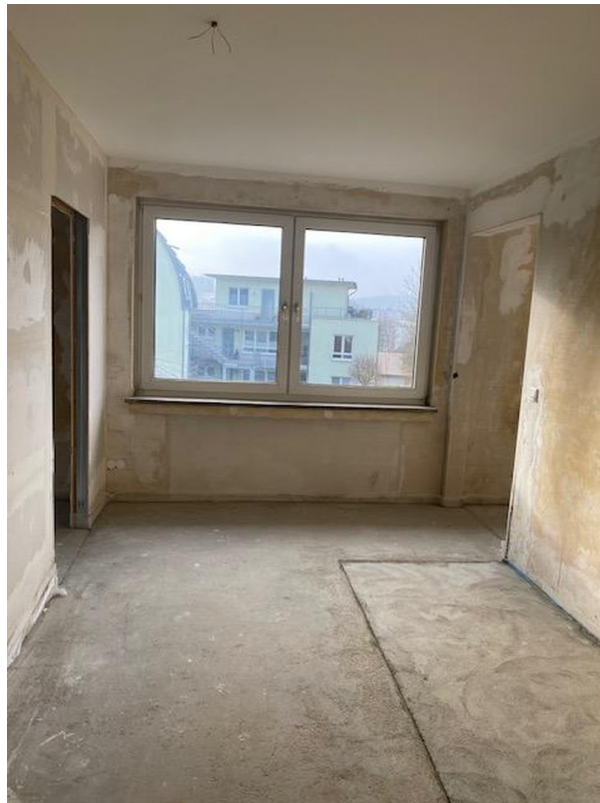
kleineres Zimmer Mitte rechts