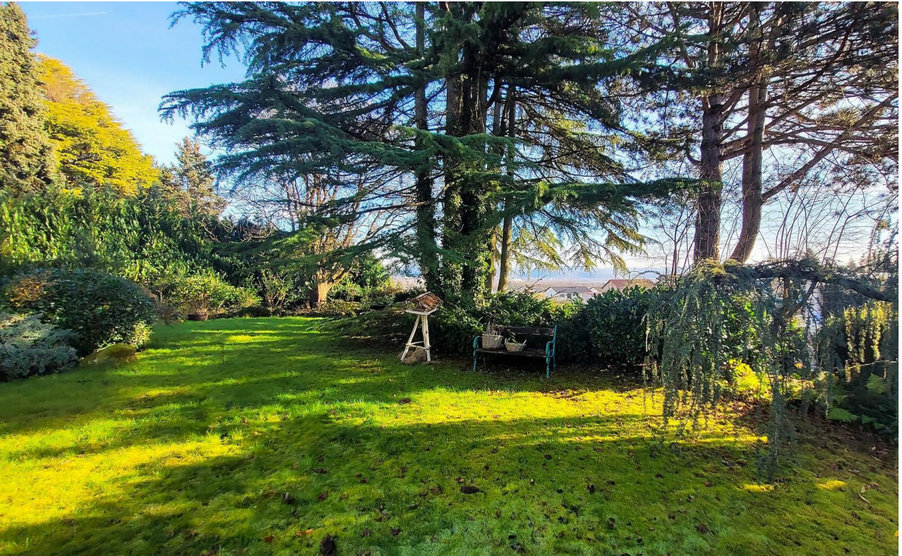
Blick ins Saartal