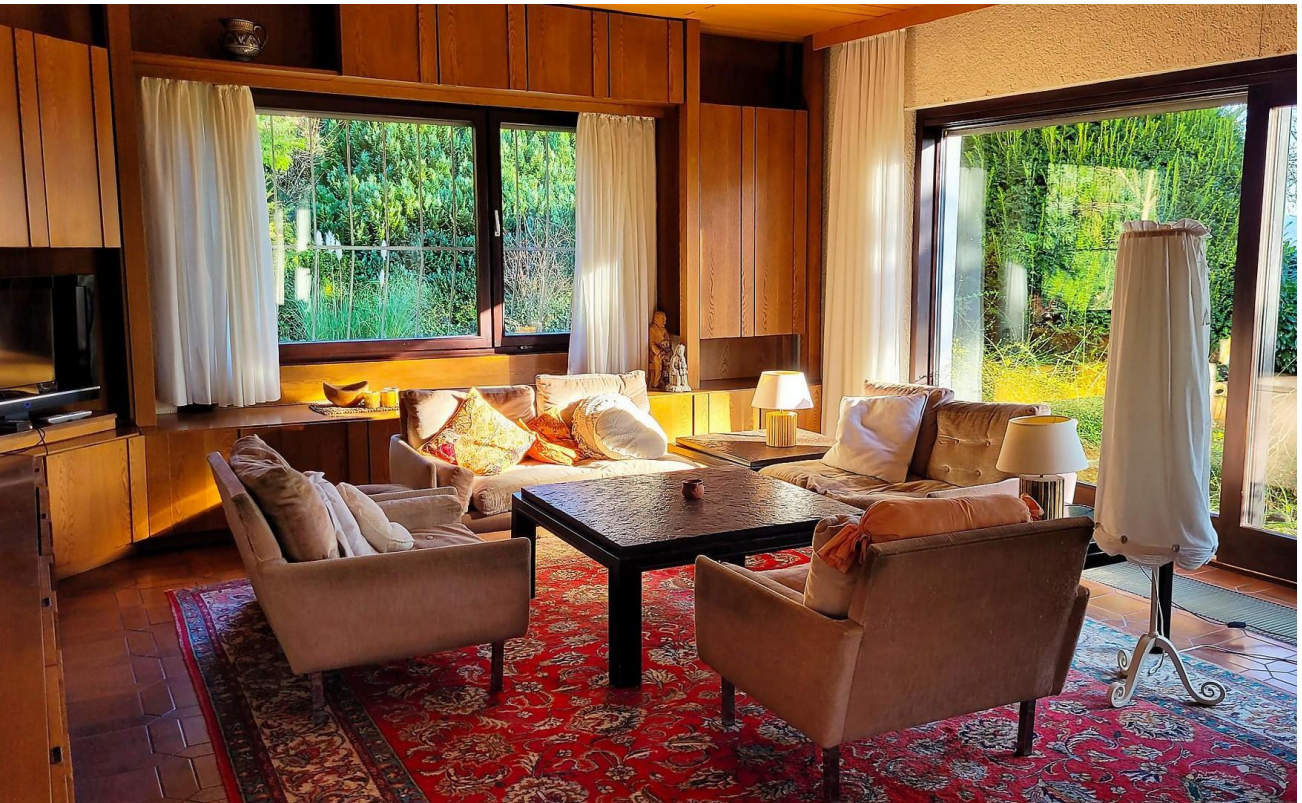
Wohnzimmer mit Ausblick