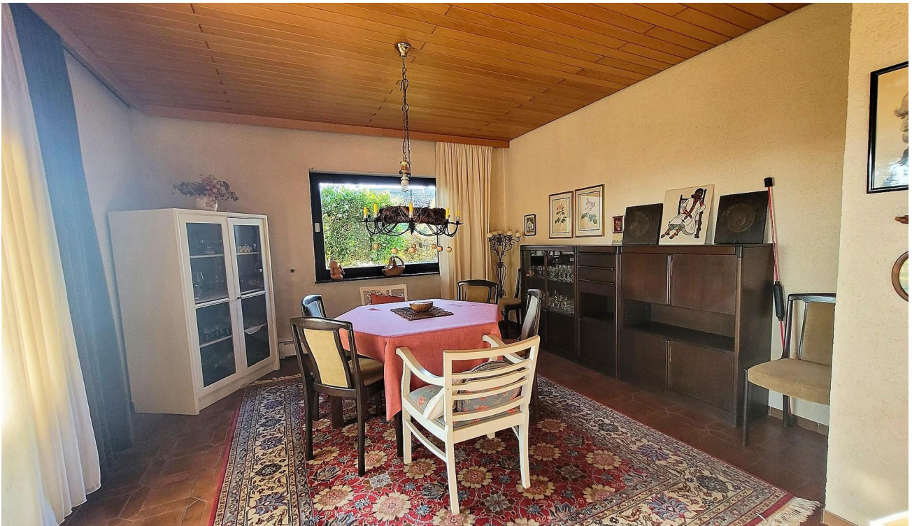
Esszimmer mit Ausgang