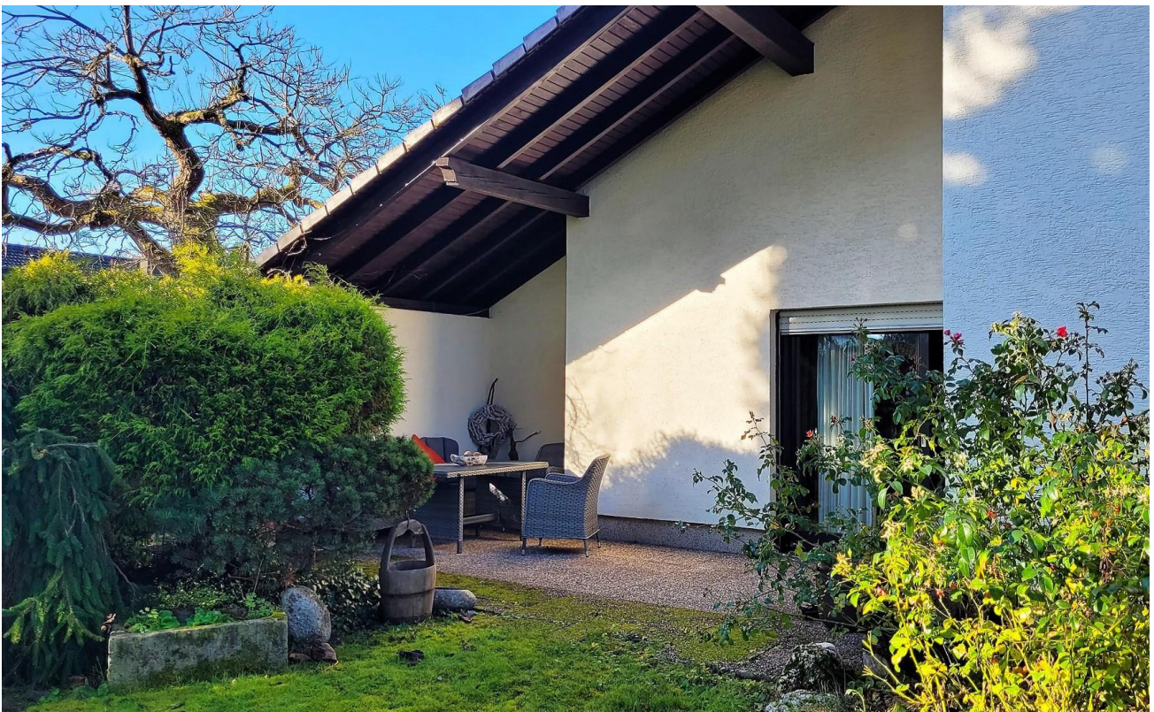
Eine der beiden Terrassen