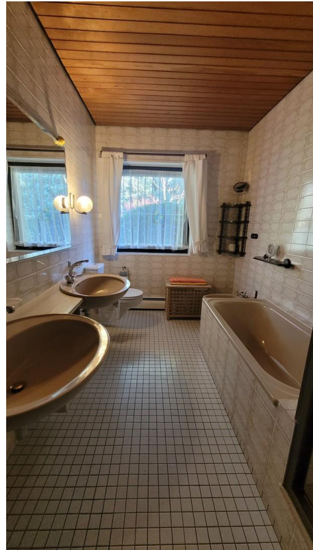
Badezimmer mit Dusche + Wann