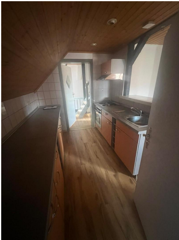
Küche in Richtung Flur