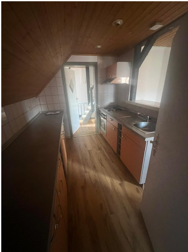
Küche in Richtung Flur