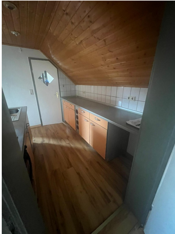
Küche in Richtung Bad