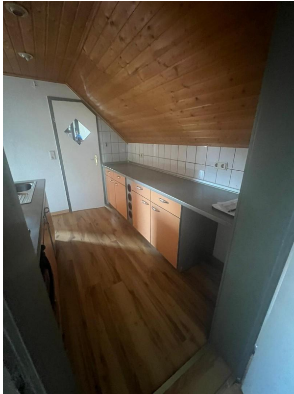
Küche in Richtung Bad