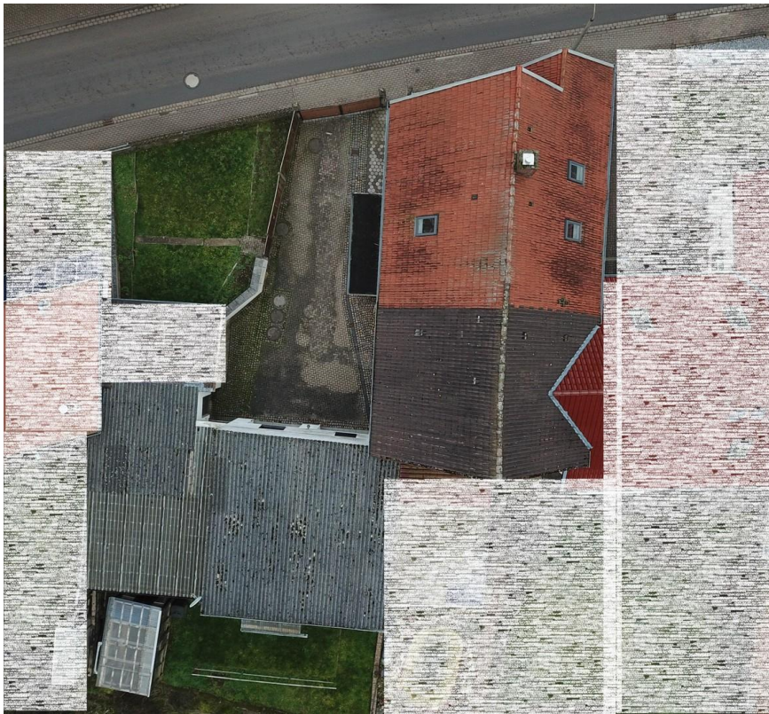
Ansicht von oben - Luftbild