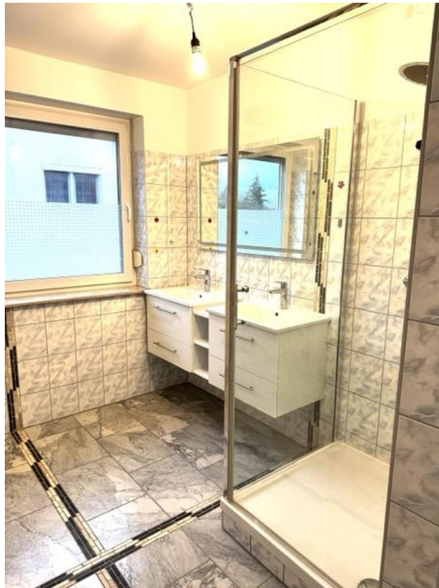
Bad im Obergeschoss