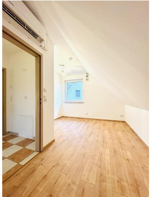
Kinder- / Arbeitszimmer