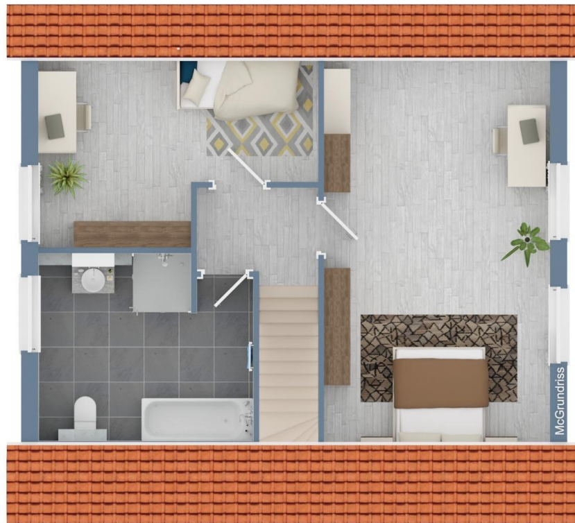
Grundriss 1. OG