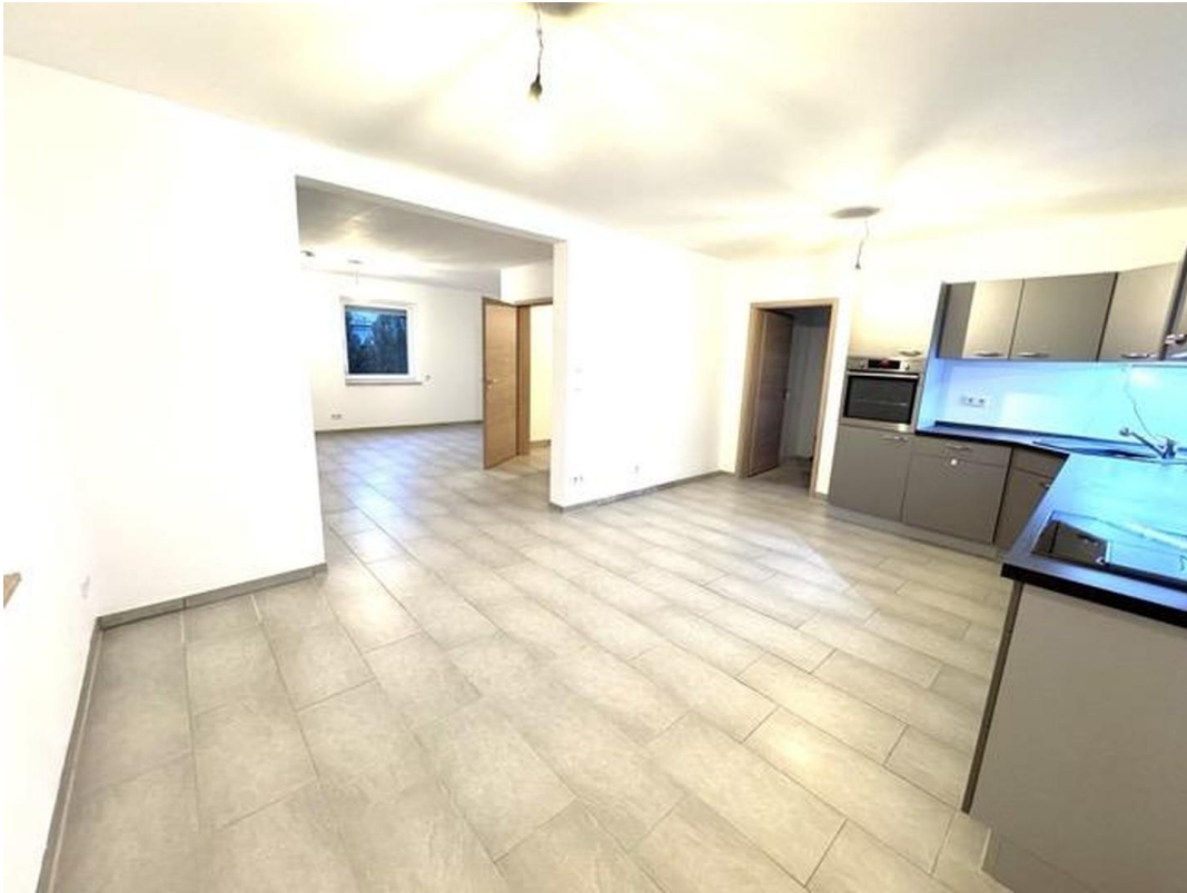
Küche / Esszimmer