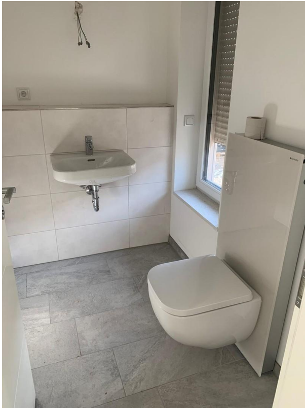
Gäste WC im EG