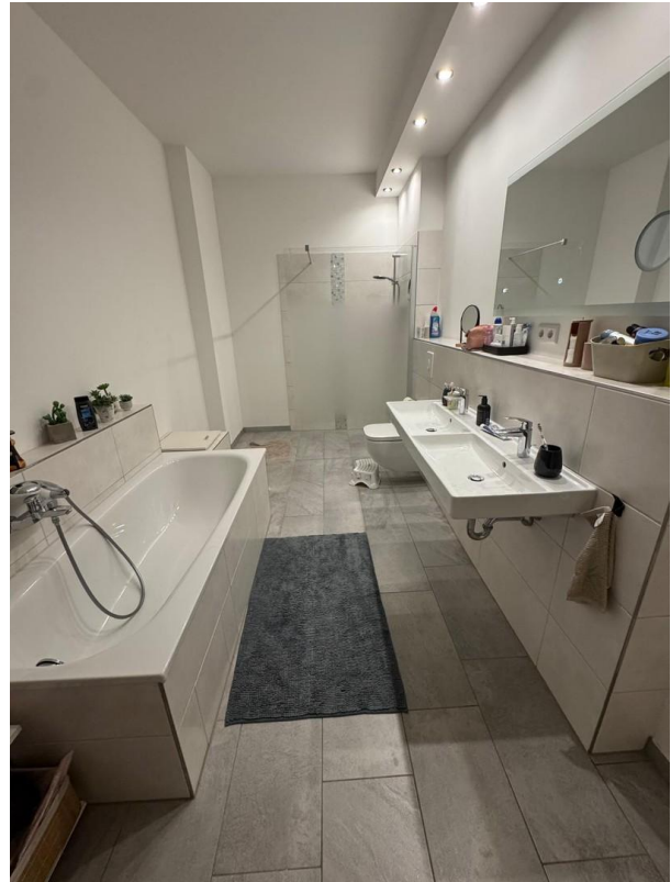
Vollbad im OG