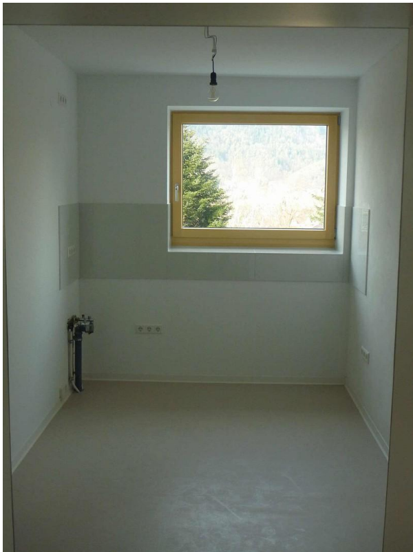
Küche ohne Einbauten