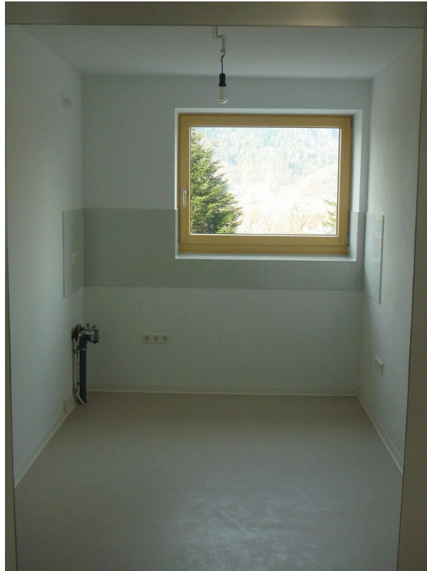
Küche ohne Einbauten