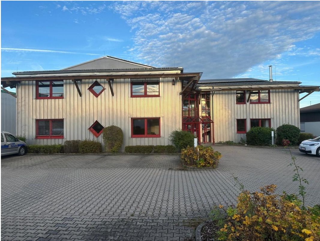
Front Strasse Hofwiesenstr.