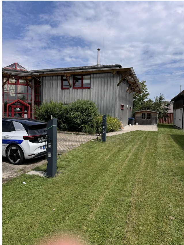
e-Ladesäulen Gebäude Hofwiesen